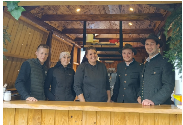
Foto: Wohlverdiente Stärkung mit regionalen Schmankerln - die Labestelle von den Kematner Jagdhornbläsern