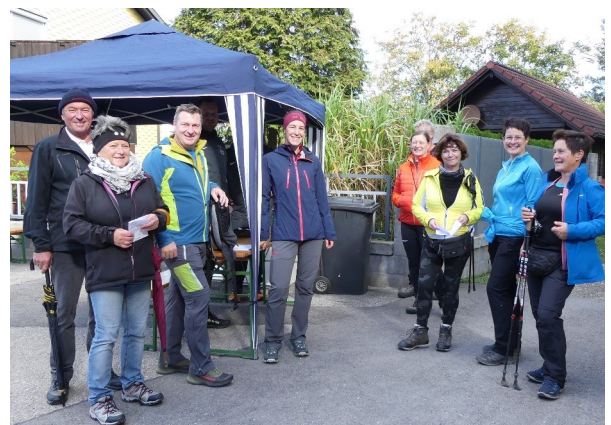
Foto: Viele Wanderer machten bei der Labestelle des ASK halt