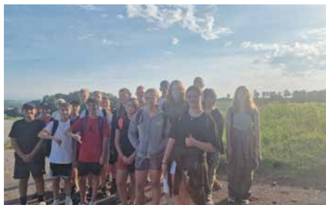
Wandertag Klasse 4A