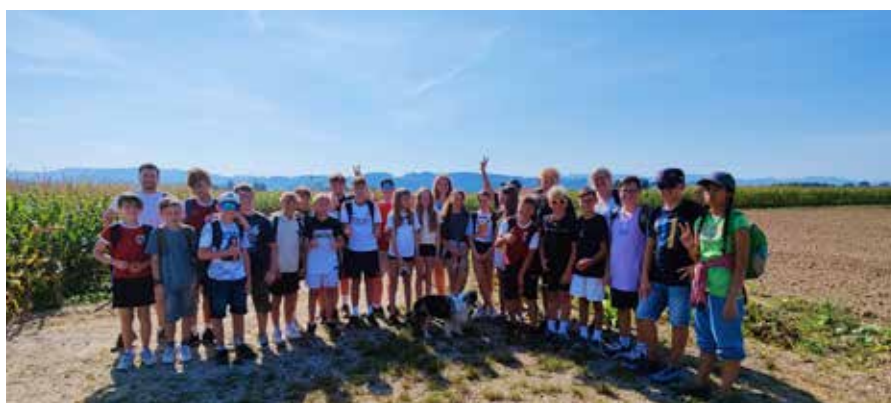
Wandertag Klassen 3A / 3B

Am Dienstag, den 12. 09. fand bei strahlendem Herbstwetter unser Halbtagswandertag statt. Die Klassen waren hauptsächlich im Ortsgebiet von Neuhofen unterwegs, aber auch Waidhofen/Ybbs oder das Schloss Ulmerfeld waren lohnende Ausflugsziele.