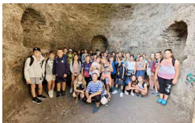
Wandertag Klassen 2A / 2B