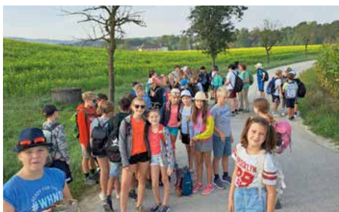
Wandertag Klassen 1A / 1B