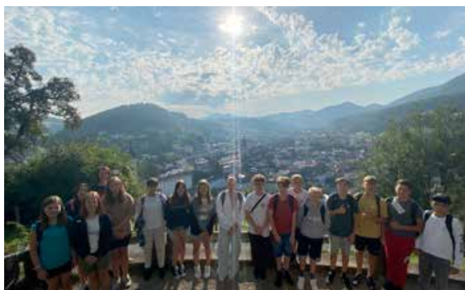
Wandertag Klasse 4B