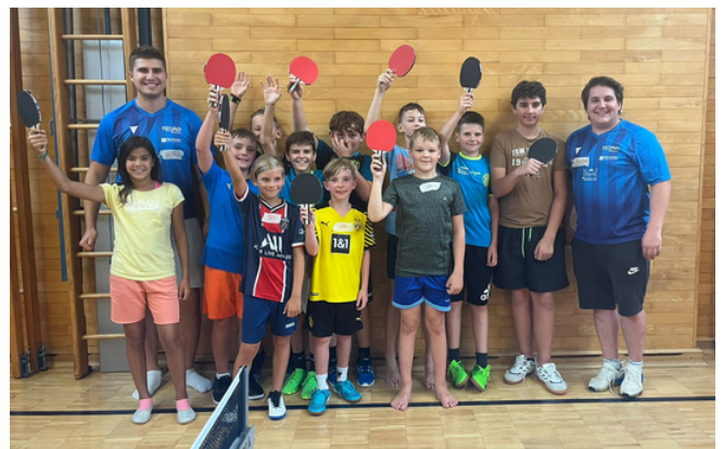
Tischtennis Tryouts - Tischtennisverein Haidershofen