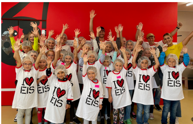
Die Buburuza Raiffeismacher - Raika Haidershofen