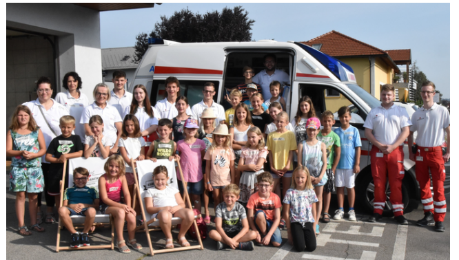
Rotkreuz Ferien Fun 2 - Rotes Kreuz Haag