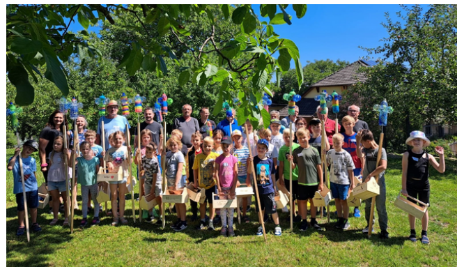
Basteln mit Holz - Siedlerverein Haidershofen