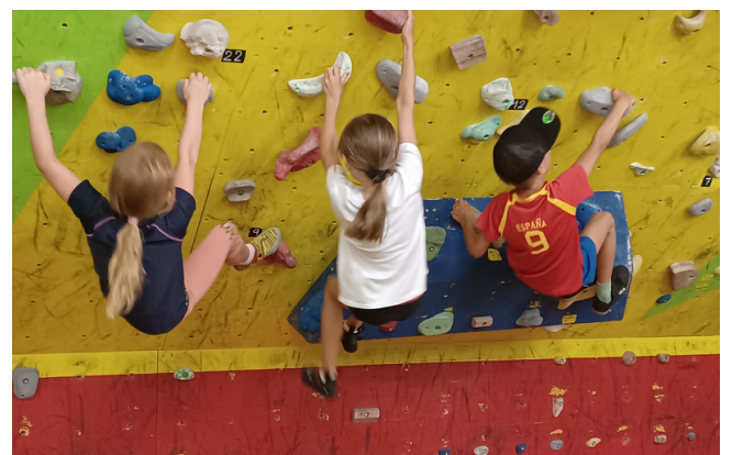
Bouldern mit Kindern - Boulder Zone Most4tel