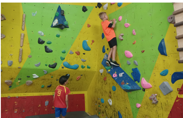
Bouldern mit Kindern - Boulder Zone Most4tel