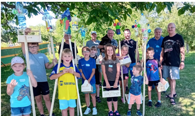
Basteln mit Holz - Siedlerverein Haidershofen