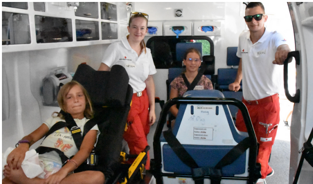
Rotkreuz Ferien Fun 1 - Rotes Kreuz Haag

Mehr Fotos zu den Ferienspielen 2023 finden Sie unter www.haidershofen.gv.at