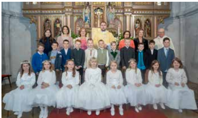
Erstkommunion 2A 18.05.2023