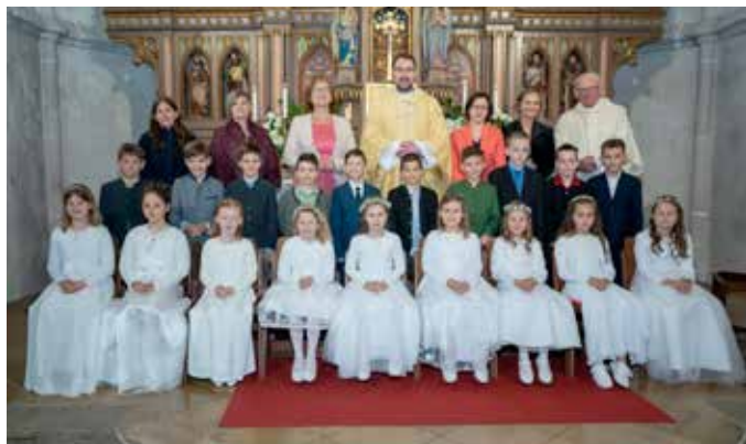
Erstkommunion 2B 18.05.2023