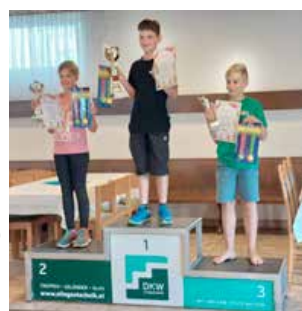
Rookie Klasse 1