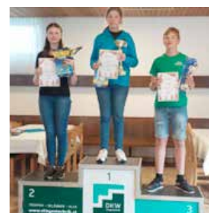
Elite XL Klasse