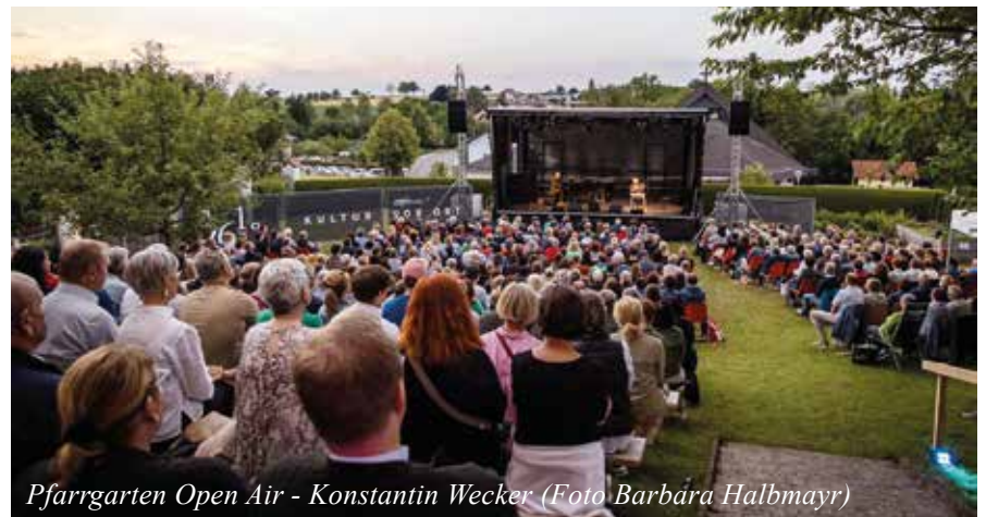
Pfarrgarten Open Air - Konstantin Wecker