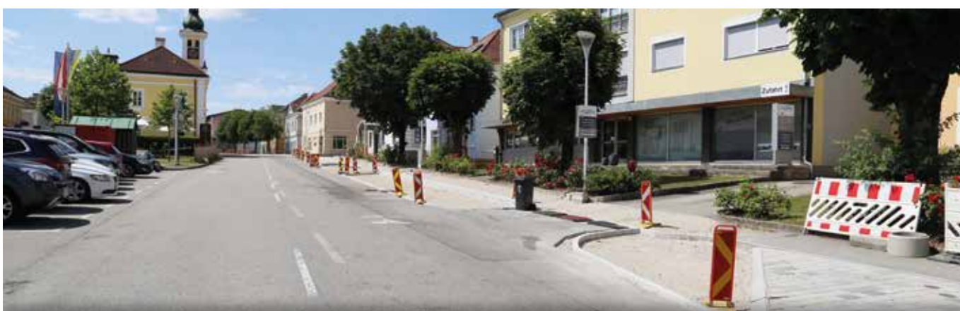
Momentan werden die Nebenanlagen vom Kindergarten am Rathausplatz bis zur Pehböck GmbH auf beiden Straßenseiten neu gestaltet. Im nächsten Jahr wird der 2. Teilabschnitt bis zum Billa-Kreisverkehr saniert.