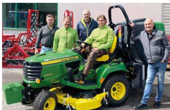
neuer John Deere Rasentraktor für den Gemeindebauhof

Seitens der Marktgemeinde Aschbach wurde vom Lagerhaus Aschbach eine neuer John Deere Rasentraktor für den Gemeindebauhof angeschafft. Das Vorgängermodell wurde an den Zweigverein Fußball für die Mäharbeiten am Fußballplatz übergeben.