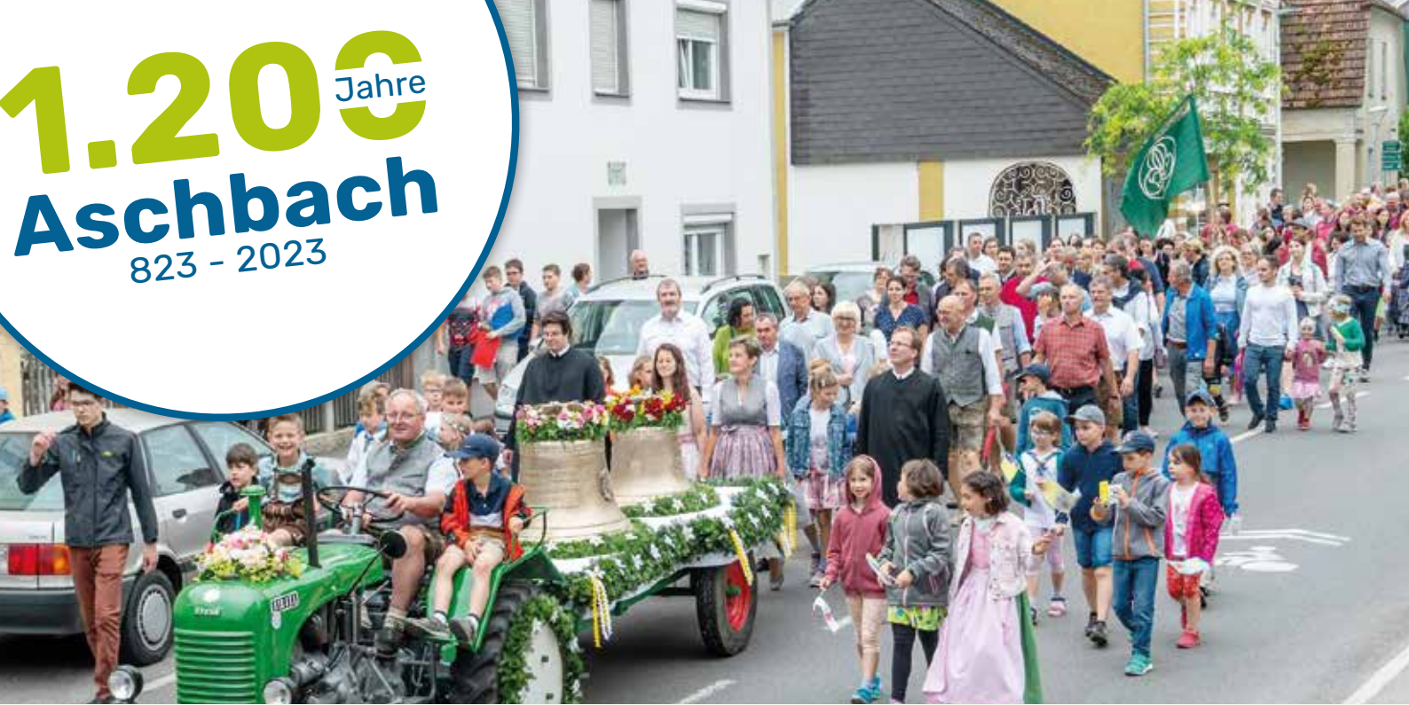
Glockenzug durch Aschbach-Markt

Neue Öffnungszeiten des Gemeindemuseums: Jeden 1. Sonntag im Monat von 9 bis 11 Uhr