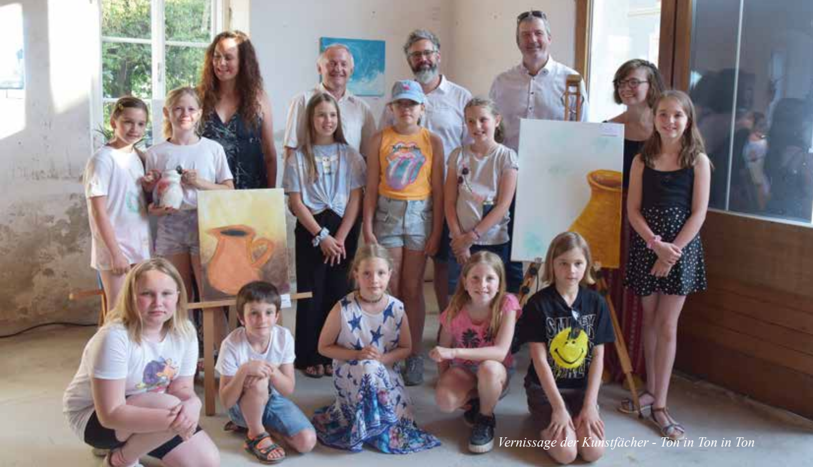
Vernissage der Kunstfächer - Ton in Ton in Ton