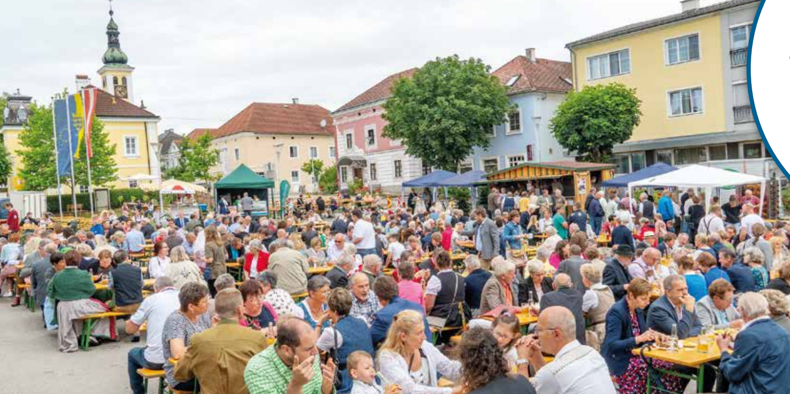
Jubiläums-Frühshoppen am Rathausplatz