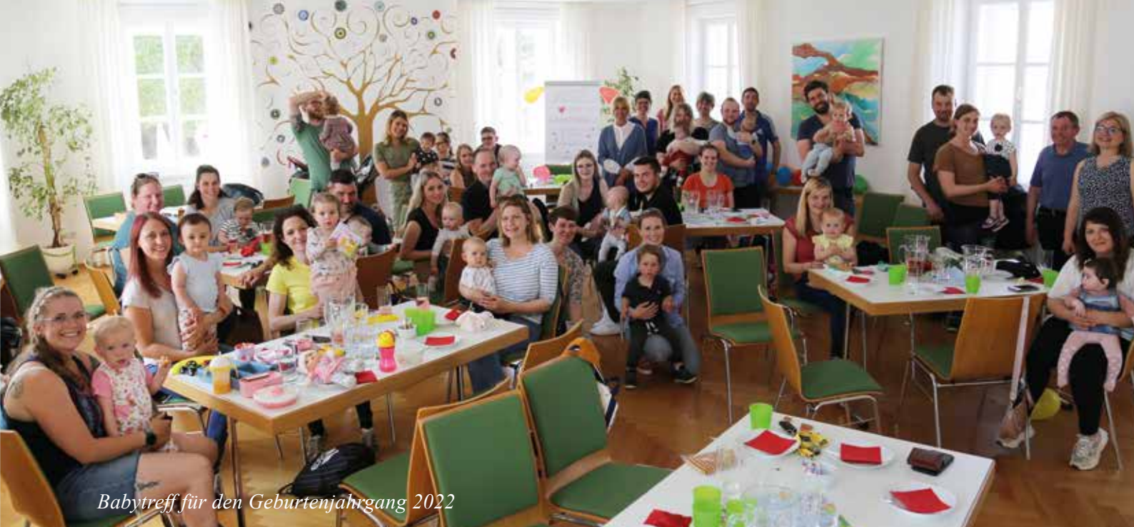
Babytreff für den Geburtenjahrgang 2022