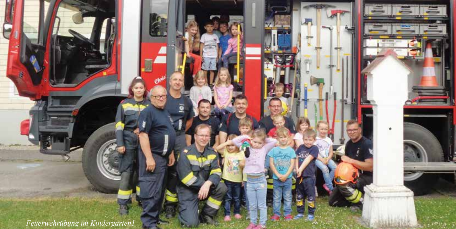
Feuerwehrrübung im Kindergarten 1