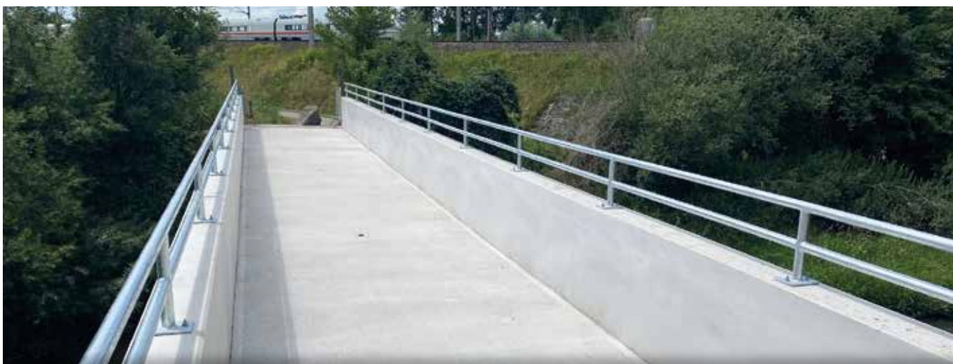
Sanierung der Urlbrücke Aubauer/Meierhofen - nach einer Woche Bauzeit wieder benutzbar (Fahrrad- und Fußgängerbrücke an den Gemeindegrenzen Aschbach-Markt/Amstetten)