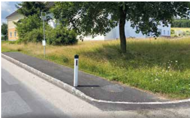
Sanierung weiterer Bushaltestellen in Aukental, Feitzing und Seidenberg