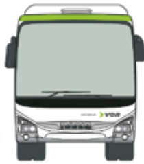
Das optimierte Regionalbus- Angebot...