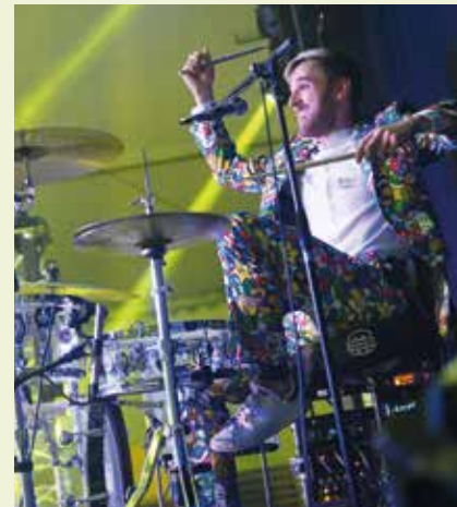
BÄÄM auf der Bühne des Fest Zsaum. Ein abwechslungsreiches und stimmungsvolles Wochenende steht bevor

stätter See zu gewinnen. Zu den drei Tagen lädt die FF Krenstetten herzlich ein.