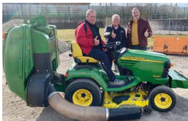
Rasentraktor für den Zweigverein Fußball