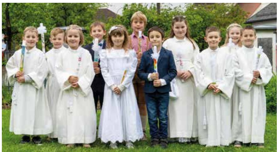
Erstkommunion in Krenstetten

Heuer war unser Ausflugsziel der Alpakahof - Riesing. Die Kinder konnten die Tiere hautnah erleben und viele interessante Infos hören. Die liebevollen, ruhigen Tiere wurden ganz aus der Nähe betrachtet, gestreichelt und gefüttert. Nachdem sich alle gestärkt hatten, konnten die Kinder ein Alpaka führen. Zum Ausklang besuchten wir noch den Spielplatz. Unser Ausflug wurde ein unvergesslicher Tag für die Kinder!