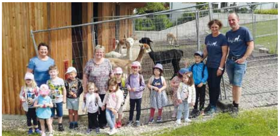
Ausflug Kindergarten 2 zum Alpakahof Riesing