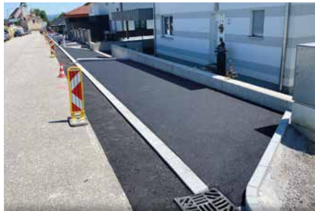
Nebenanlagen Großmarkstein (Krenstetten)