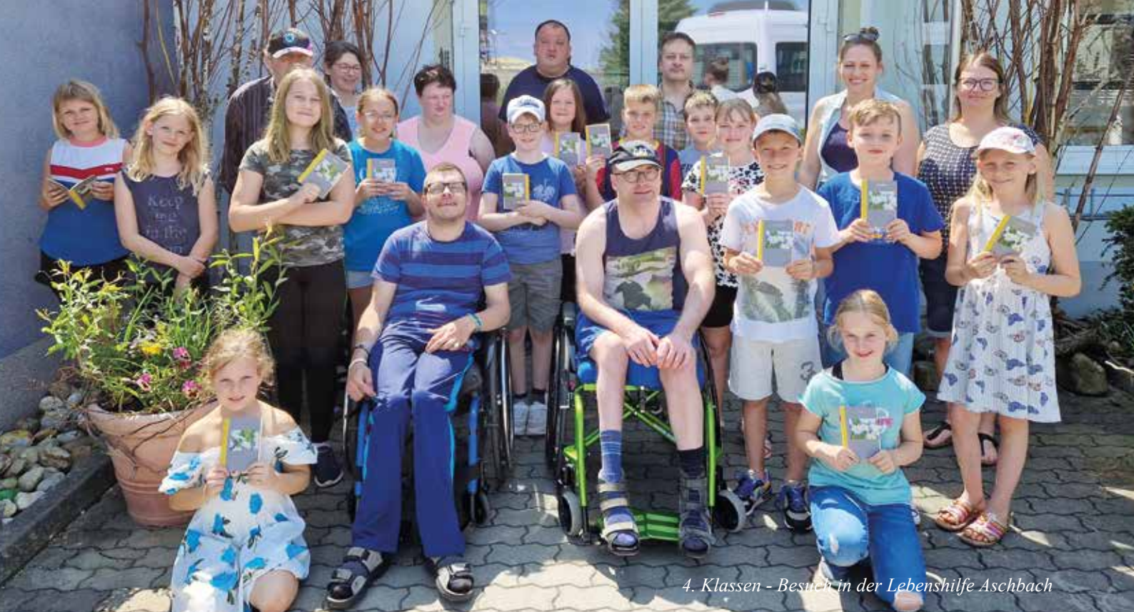
4. Klassen - Besuch in der Lebenshilfe Aschbach