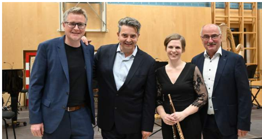
Einen großartigen Abend um die Geschichte des (Wiener) Walzers durften die Besucher des Konzerts im Turnsaal der Mittelschule Ybbsitz erleben. Christoph Wagner-Trenkwitz führte mit seiner charmanten und humorvollen Art durch diesen großartigen klassischen Konzertabend.