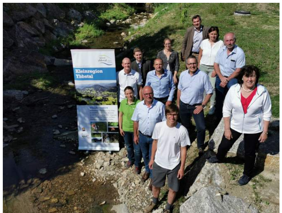
Erfolgreiche Gemeindekooperationen in der NÖ Kleinregion Ybbstal.

Gemeinsam freut man sich über die auf Kleinregionsebene gelungene Kooperation. Es ist ein wesentliches Ziel in der Kleinregionsstrategie 2021-2024, die systematische Erfassung und lückenlose Kontrolle von Bäumen und Wildbächen auf professionelle Beine zu stellen und flächendeckend umzusetzen.