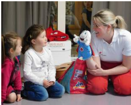
Wir bedanken uns für den äußerst kompetenten und pädagogisch wertvollen Besuch.

Anfang Mai besuchte ein Team der Bezirksstelle Waidhofen an der Ybbs den Kindergarten. Auf spielerische Weise tauchten die Kinder in die Welt des Rettungsdienstes ein. Es wurde verbunden, getragen, Gerätschaften vorgestellt und ausprobiert, der Erste Hilfe Kasten gepackt und das Rettungsauto erkundet.