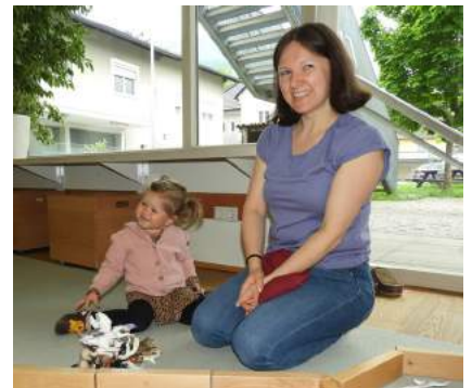
Erste Eindrücke konnten die Kinder mit ihren Eltern Ende Mai im Kindergarten 1 sammeln und sich mit dem Kindergarten vertraut machen.

Der Kindergarteneintritt ist der Beginn eines neuen Lebensabschnittes, der mit neuen Erfahrungen und Erlebnissen verbunden ist und den Kindern vielfältige Lern- und Lebensräume eröffnet. Das Kind braucht Zeit, um sich an die noch neuen Situationen, an unbekannte Räume und an einen veränderten Tagesablauf zu gewöhnen.