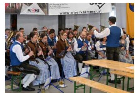
Ein großer Dank gilt dem Musikverein Ybbsitz für die musikalische Umrahmung der Florianimesse und des Frühschoppens.