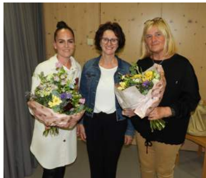
Herzlichen Dank an die Firma Edelsegger Metals, welche mit ihrer großzügigen Spende die gesamten Kosten des Elternabends getragen hat.