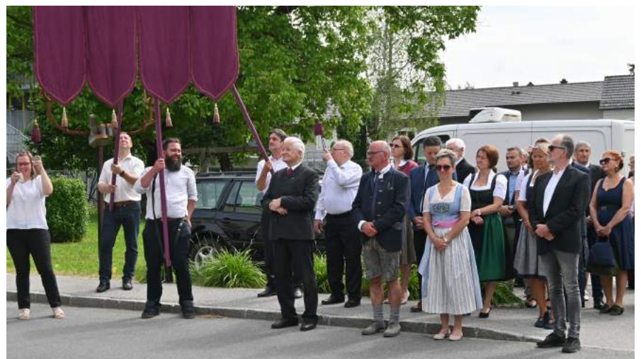
Bei herrlichem Wetter fand die Fronleichnamsprozession heuer wieder in traditioneller Form statt. Nach der Festmesse nahmen verschiedene Abordnungen an der Prozession teil, welche beginnend vom Marktplatz zu den Altären bei der Florianikapelle und bei Familie Kainrath wieder zurück zum Kirchenplatz führte.