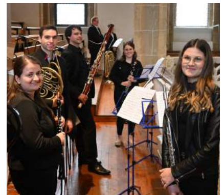
Mit erlesenen Stücken umrahmten Ensembles des MV Ybbsitz den Klangschmiede-Gottesdienst in der Pfarrkirche Ybbsitz.