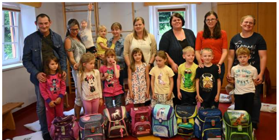
Abschiedsfeier für die Schulanfängerkinder.

Beim Wandertag im Juni besuchten die Kinder Familie Grabner, Haus „Langsen“ im Zogelsgraben. Für die Schulanfänger gab es in der letzten Woche noch besondere Abenteuer: sie durften die Schultaschen mit in den Kindergarten bringen und sie verbrachten eine Nacht im Kindergarten unter dem Motto: „Bevor wir in die Schule kommen, schlafen wir uns im Kindergarten nochmal richtig aus!“ An diesem Abend durften sie auch die Feuerwehr besuchen und vieles