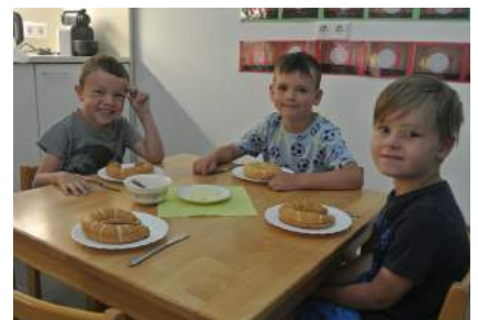
Herzlichen Dank an die Bäckerei Molterer, welche die Frühstückskipferl gesponsert hat.

Auf dem Weg zur Autonomie verbrachten die Kinder eine Nacht im Kindergarten. Gemeinsam wurde gesungen, gespielt und Pizza gegessen. Nach dem abendlichen Spaziergang zum Freibadspielfplatz genossen die Kinder ein Kindergartenkino und dann hieß es „ab ins Bett“. Mit Taschenlampen und Kuscheltieren und viel Mut zum Abenteuer verlief eine sehr ruhige Nacht, nach welcher die Kinder „sichtlich gewachsen“ und mit einem Lächeln im Gesicht wieder erwacht sind. „Seid stolz auf euch, denn niemand außer euch weiß, wieviel Kraft, Mut und Vertrauen es gekostet hat, die-