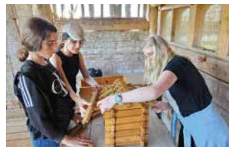
Keltendorf - Blockhaus