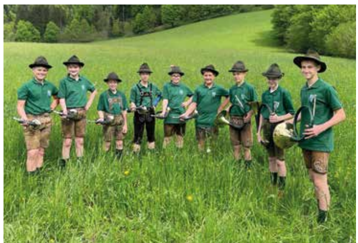
JagdhornKitz aus Öhling, Oed, Sindelburg, Zeillern und Ardagger