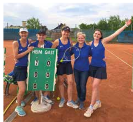
Die 1er-Damen beim 7:0-Sieg

Neben Meisterschaft und Trainings standen in den letzten Wochen auch die Vorbereitungen für das 1. UTV-Sommerkino, das am 24. Juni im Sturmhof stattfand, auf dem Programm.