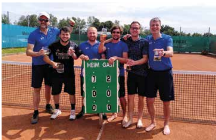
Die 1er Herren auf ihrem Weg zum Aufstieg

Ebenfalls auf unserem Sommerprogramm steht wieder das 3-tägige Kindertenniscamp für alle Kids im Alter von 6 bis 14 Jahren: Von 14.-16. Juli gibt's für Anfänger bis Fortgeschrittene verschiedene Spiele, Übungen und Trainings. Anmeldung: Magdalena Otto (0680/ 230 68 62), Melanie Resch (0664/ 734 89 064).