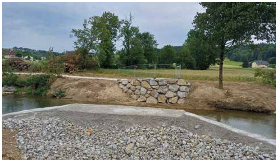
Bauarbeiten an der Url für die Radwegbrücke