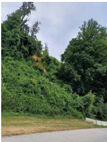
Totalsperre Landesstraße Urtal

Bei den Starkregenereignissen im April ist es auf der „Lederleiten“ oberhalb der Landesstraße Urtal – Haus Atzenhofer (ehem. Litzellachner-Mühle) ein Hangrutsch entstanden. Da nicht ausgeschlossen werden kann, dass bei den nächsten intensiven Regenfällen es zu einem weiteren Abrutschen des Erdmaterials kommen kann, hat die Straßenbauabteilung eine Sperre der Landesstraße ausgesprochen. Der geologische Dienst des Amtes der NÖ Landesregierung hat das Schadensereignis als Katastrophenfall eingestuft, sodass für die Sanierung Mittel aus dem Katastrophenfonds herangezogen werden können.