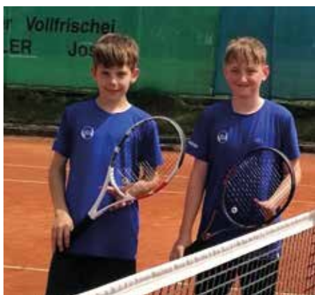
Unsere erfolgreichen U13-Boys

Mit je 7 Runden neigt sich Anfang Juli die Kreismeisterschaft für alle 5 Mannschaften zu Ende. Auch heuer war es – trotz Personalengpässe - wieder möglich zwei Damen – sowie zwei Herrenmannschaften und eine U13-Mannschaft aufzustellen. Aufgrund des durchwachsenen Wetters in dieser Saison, mussten jedoch einige Partien verschoben werden. Sehr erfolgreich unterwegs waren heuer die 1er Damen sowie die 1er Herren – ein Aufstieg ist noch in Reichweite! Auch unsere U13-Boys hatten bereits die Möglichkeit bei den Herren in der Kreisliga F mitzuspielen.