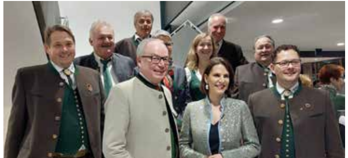
Auftritt im Festspielhaus St. Pölten

Vorankündigung: Gemeinsam mit der Öhlinger Jägerschaft werden beim Birnenfest am 13. August in Öhling wieder Wildköstlichkeiten zubereitet. Jagdhornmusik darf dabei natürlich auch nicht fehlen.