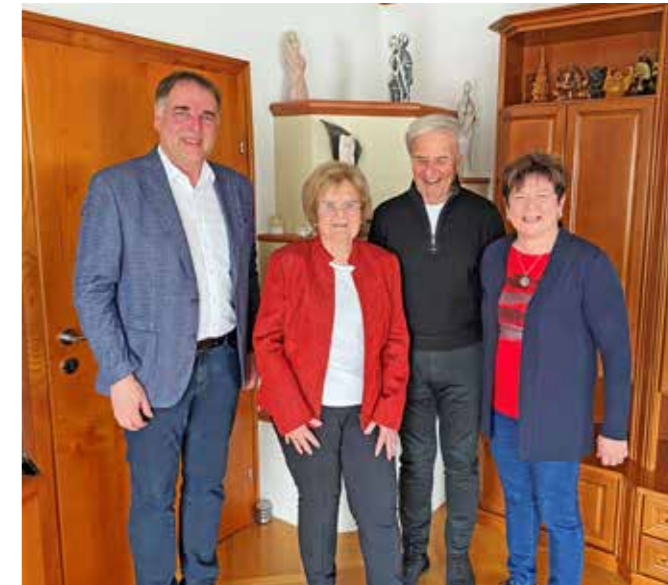
KOPF Heli, Rosenau Gratulation zum 80er!