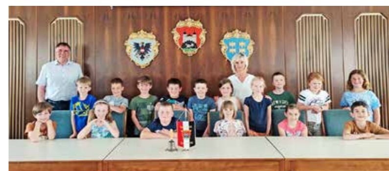
3. Klasse VS Rosenau