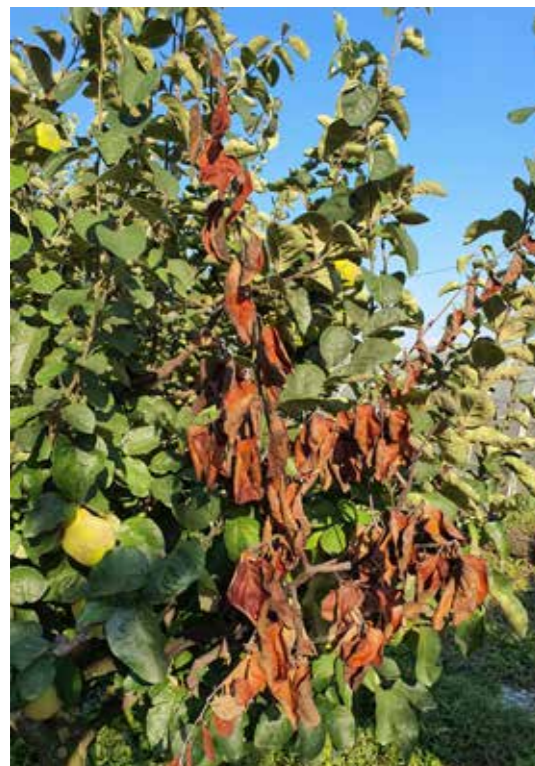
Feuerbrand an Quitte