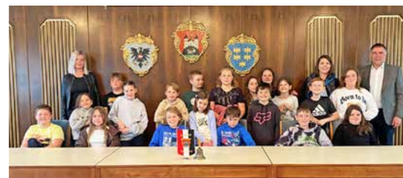
4. Klasse VS Böhlerwerk