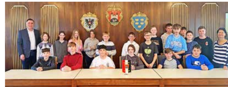
3. Klasse PMS Gleiß

Danke für das Ermöglichen des coolen Trips an alle Eltern und an das Team Fluch, Schachermayr und Reitner für die Organisation und Durchführung.