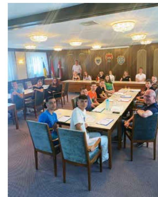
4. Klasse MS Sonntagberg

Im Frühling besuchten gleich mehrere Schulklassen im Rahmen eines Lehrausganges das Gemeindeamt in Rosenau. Nach der persönlichen Begrüßung durch Bgm. Thomas Raidl erhielten die Schüler Einblicke in die verschiedenen Abteilungen der Gemeindeverwaltung und deren vielfältigen Aufgaben. Ein Highlight war zum Abschluss das Nachspielen einer Gemeinderatssitzung im Sitzungssaal. Wie im echten politischen Leben brachten Schüler in der Rolle als Gemeinderäte Anträge ein und es wurde diskutiert und abgestimmt. Zum Abschluss wurden die Schüler auf eine kleine Jause eingeladen! Wir bedanken uns für die lieben Besuche!