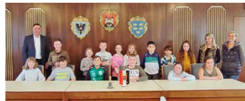
3. Klasse PVS Gleiß