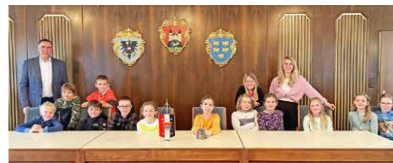
3. Klasse VS Böhlerwerk