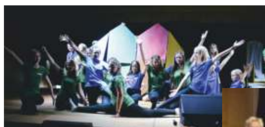
Das Herz am Schluss des Musicals.