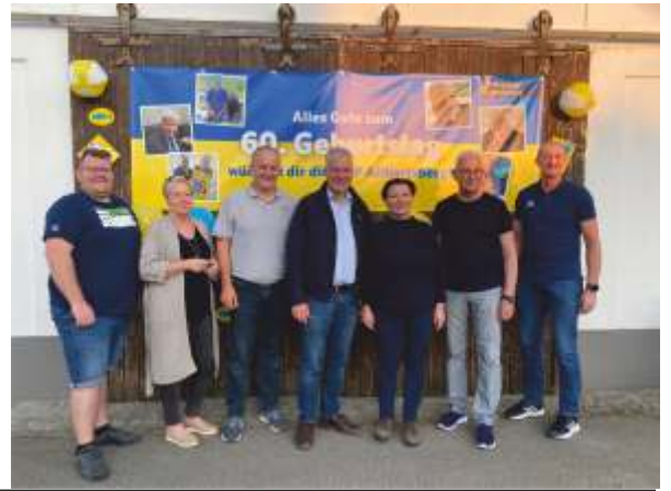
Die Mitglieder der ÖVP Allhartsberg stellten am Vortag seines Geburtstages ein Plakat auf dem Gemeindeamt und auch beim Bürgermeister zu Hause auf.