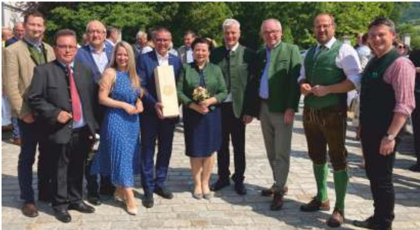
Der Agrarklub des NÖ Landtages stellte sich als Gratulant beim Fest ein.