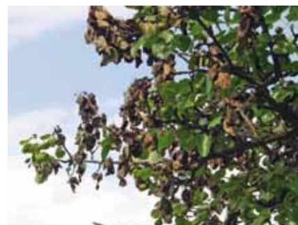
Foto: Ein von Feuerbrand befallener Obstbaum.