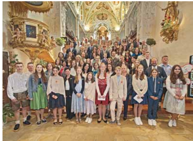
Foto: Die Firmlinge mit ihren Paten und Patinnen gemeinsam mit den VertreterInnen von Politik und Geistlichkeit.

einer äußerst motivierenden Predigt in einen neuen Lebensabschnitt. Danke für das wunderbare Fest, das hier den jungen Menschen gemeinsam „bereitet“ wurde. Den jugendlichen Firmlingen wünschen wir auch seitens der Gemeinde auch auf diesem Weg alles Gute. Sie haben mit der Firmung einen weiteren symbolischen Schritt in Richtung eines selbstbestimmten und wertvollen Lebens gesetzt!