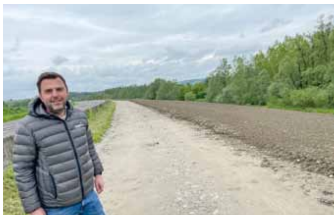
Foto: Christoph Hinterholzer vor dem bereits angeschütteten Bereich auf der Außenseite des HWSchutzdammes.

werden die Anschützmaßnahmen wieder intensiviert und haben schon einen sehr weit gediehenen Umsetzungsgrad erreicht. Das Vorhaben wird im Zusammenwirken mit der Firma Hinterholzer umgesetzt. Danke für die gute Zusammenarbeit zum Schutz unserer Bevölkerung!