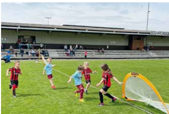
Foto: Die langgediente Tribüne am Sportplatz wird in den nächsten Monaten erneuert.