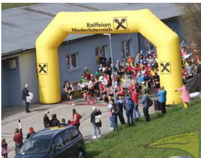
Foto: Ein riesiges Starterfeld beim Hauptlauf des Donau-Au-Halbmarathons.