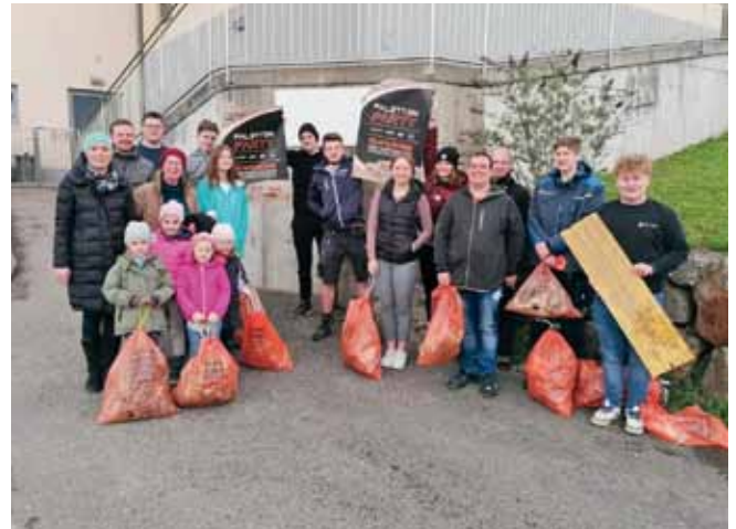
Foto: Diese Müllsammlerinnen und Müllsammler waren in Ardagger Stift unterwegs und konnten viele Säcke mit weggeschmissenen Dingen finden.

Übrigens können wir alle auch dazu beitragen, dass die Flurreinigung gleich gar nicht notwendig ist: Indem einfach gleich gar nichts mehr weggeschmissen wird, nichts liegen bleibt und auch nichts davonfliegt. Danke nochmals den vor allem auch vielen jungen Menschen für die Säuberungsaktion!