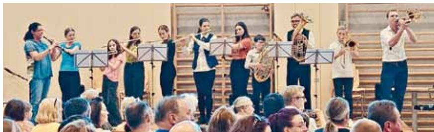
Foto: Die Schülerinnen und Schüler der Musikschule Ybbsfeld und VertreterInnen der Musikkapellen präsentierten das Konzert „Das kleine Ich bin ich“.

rinnen und Musiklehrer und Musikanten. Auch für 2024 ist bereits ein Konzert in Planung, bei dem es dann um ein freches, rothaariges Mädchen mit zwei abstehenden Zöpfen geht... Wer könnte da wohl gemeint sein?!