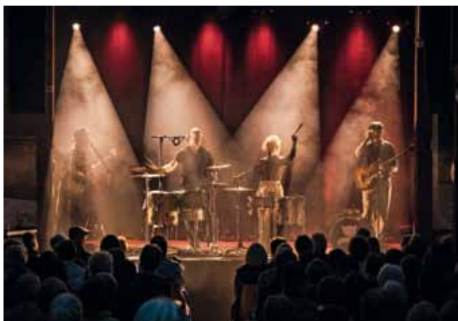
Foto: Ein vielfältiges Programm begeisterte das Publikum beim Zoa-Festival.