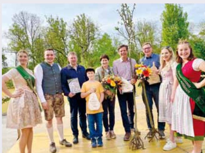
Foto: Auf den Bildern sehen sie die Mosthersteller, den engeren Vorstand der Landjugend und die Mostprinzessinnen.