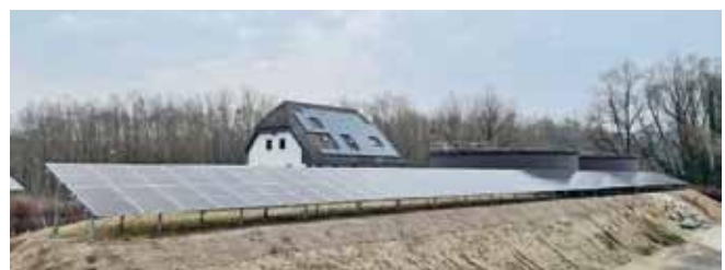
Foto: Rund um die Kläranlage Ardagger wurde eine 84 KWp starke PV-Anlage mit Speicher installiert.