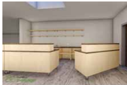
Grafik: So soll die neue Ausschank bei der Sporthalle der Mittelschule aussehen.

Im Gemeindevorstand wurde nun beschlossen, für die Sporthalle bei der Mittelschule einige mobile Elemente für eine Ausschankmöglichkeit anzuschaffen. Gerade bei Musikkonzerten oder Flohmärkten und Basaren sollte das für die Vereine und Veranstalter eine Hilfe sein! Die Zusatzausstattung soll im Lauf des Herbst fertig sein.