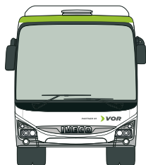
Das optimierte Regionalbus- Angebot...