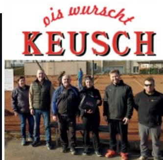
bei Fleischerei Keusch für die Bratwürstel