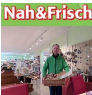
bei Reschauer KG für Brot und Gebäck

Ein besonderer Dank gilt auch der Firma Landsteiner und Volksbank Niederösterreich , die uns bereits im letzten Jahr zahlreiche Kinderschläger sowie einige Trainingsgeräte gesponsert haben!