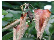
Feuerbrand ist MELDEPFLICHTIG!

Es entstehen keine Kosten, für Mensch und Tier besteht keine Gefahr!