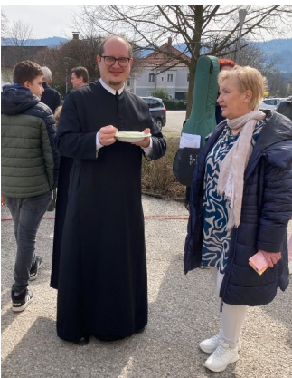
Foto: Auch Pfarrer P. Vitus Weichselbaumer genoss eine wohlschmeckende Suppe

Am traditionellen Fastensuppenonntag gab es vieles gemeinsam zu feiern. In der heiligen Messe fand die offizielle Vorstellung der Firmlinge statt. Danach luden Pfarrer Pater Vitus Weichselbaumer und der Pfarrgemeinderat zum traditionellen Fastensuppenessen herzlich ein. Der EZA Markt im Pfarrsaal bot eine Auswahl an fair trade Köstlichkeiten.