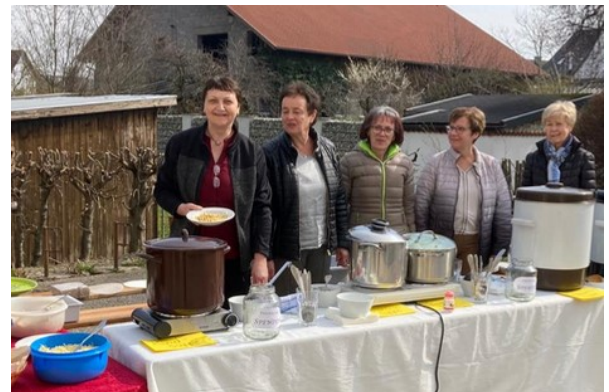
Foto: Die hausgemachten Suppen unterstützten Frauenprojekte auf den Philippinen