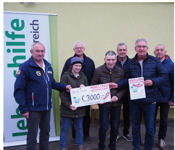
Foto: Der Gesamterlös der Veranstaltung in Höhe von € 3.000,-- wird an die Lebenshilfe Werkstätte Hiesbach und Werkstätte Naturhof Öhling gespendet