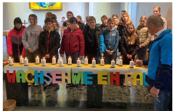
Foto: Die diesjährigen Firmlinge wurden im Rahmen der Hl. Messe vorgestellt