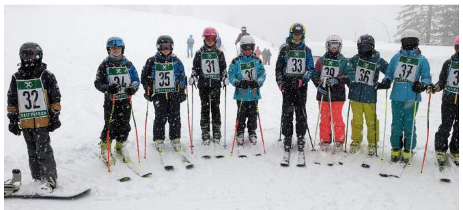
Nach dem Stück hatten die SchülerInnen die Chance die SchauspielerInnen persönlich kennenzulernen, Autogramme zu bekommen und Fotos zu machen.

Ende Jänner verbrachten die zweiten Klassen eine großartige Skiwoche in Donnersbachwald. Bei durchwachsender Wetterlage zogen die SchülerInnen ihre Schwünge ins Tal und konnten ihr Können bei einem Abschlussrennen unter Beweis stellen. Natürlich kam auch das Gemeinschaftliche nicht zu kurz und bei den bunten Abendprogrammen wurde gesungen, gespielt, gelacht, geschauspielert und auch ausgiebig getanzt.