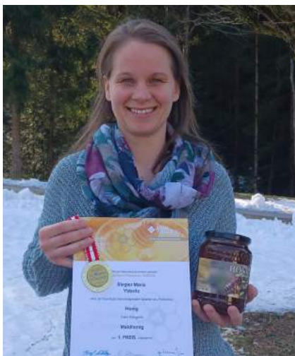
Gold für Waldhonig.

Beim bekannten Produktwettbewerb „Die Goldene Honigwabe“ im November 2022 im Rahmen der BIO Österreich Messe in Wieselburg durften sich die Ybbsitzer Imker über Auszeichnungen für ihre hochwertigen Produkte freuen.