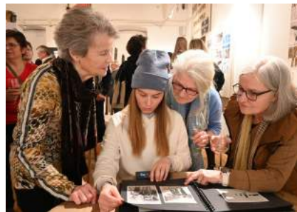
Die Ausstellung lässt viele nostalgische Erinnerungen wachwerden.