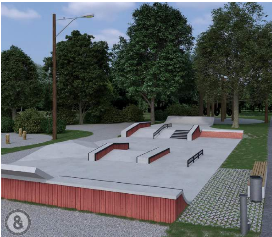
Planungsansicht des neuen Skateparks im Dr. Meyer-Park © Darko Stevanovic Skatepark Design & Planung

Hochwasserschutz in der Prolling, Gemeindestraßen- und Güterwegbau, Fertigstellung Radweg Steinmühl, Wasserleitungs- und Kanalbau, Skatepark und Abwicklung Ankauf Feuerwehrfahrzeug HLF2.