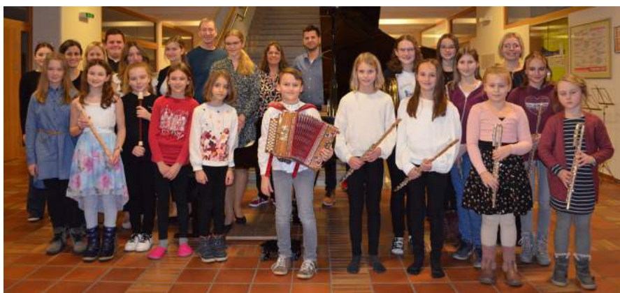
Schaufenster Ybbsitz - am 25. Jänner 2023 gestalteten die MusikschülerInnen mit ihren Lehrkräften ein wunderbares Konzert in der Aula der Mittelschule.