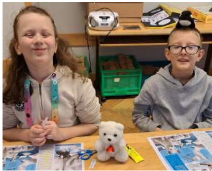
Es macht den SchülerInnen sichtlich Freude, einander täglich zu treffen und die Möglichkeit zu haben, beisammen zu sein und gemeinsam zu lernen.