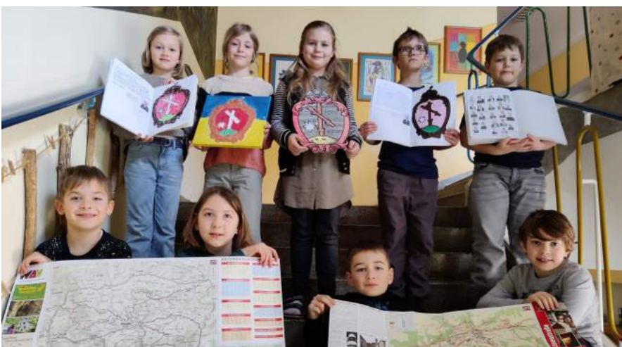
Kinder der 3b Klasse mit ihren Arbeitsunterlagen über unseren Ort

Groß war die Freude über einen Bücher-Rucksack „MINT ist mehr“: Zur Verfügung gestellt vom Buchklub Österreich in einer Kooperation mit der ARGE Naturwissenschaften beinhaltet er Bücher im Wert von mehr als € 120,-, damit kann der Unterricht an unserer MINT-Schule noch anschaulicher und interessanter gestaltet werden..