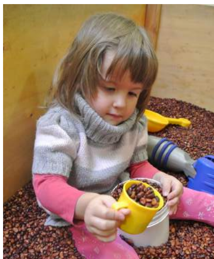
Das Spiel des Kindes dient dem Zweck seine Umwelt mit allen Sinnen wahrzunehmen und zu erobern und um die eigene Persönlichkeit auszubilden.

„Spielen – Können“ ist entwicklungspsychologisch betrachtet, eine der größten Herausforderungen im Heranwachsen eines (Kindergarten) Kindes. Diese Königsdisziplin will gelernt und geübt werden.