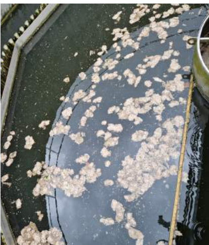
Vermehrter Fetthanfall im Abwasser

Es wird eindringlich darauf hingewiesen, dass es verboten ist, sämtliche Fette und Öle über das öffentliche Kanalnetz zu entsorgen. Des Weiteren führt dies auch zu Problemen beim Hauskanal jedes Einzelnen!