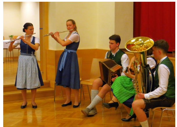
Das Ensemble „6erlei Musi“ des Musikschulverbandes begleitete die Veranstaltung musikalisch