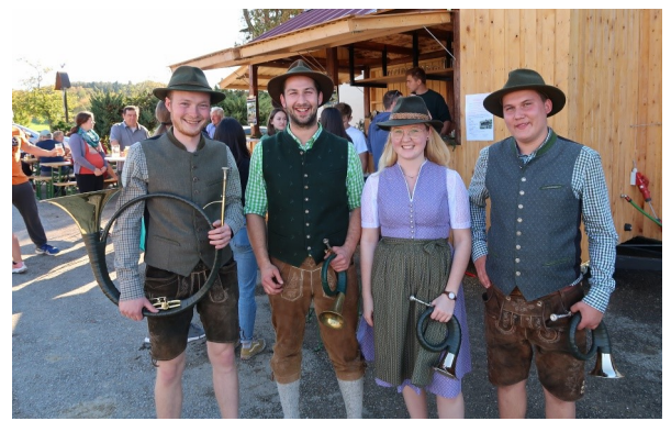
Foto: Wohlverdiente Stärkung mit regionalen Schmankerln - die Labestelle von den Kematner Jagdhornbläsern