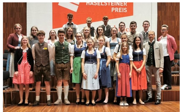
Teilnehmer aus dem Ybbstal