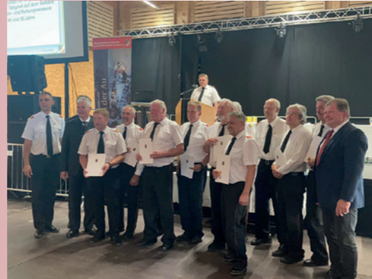
Ehrung 40 Jahre Tätigkeit 17. Juni 2022