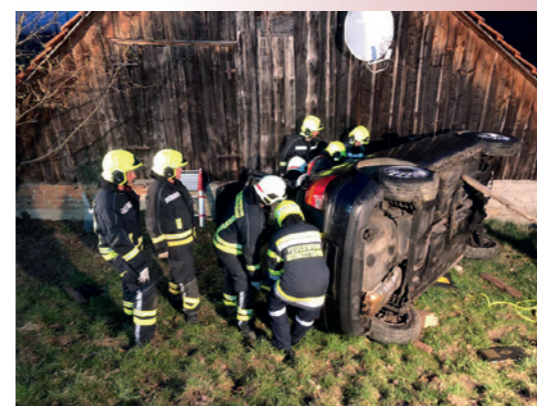
Übung Menschenrettung 30. März 2022