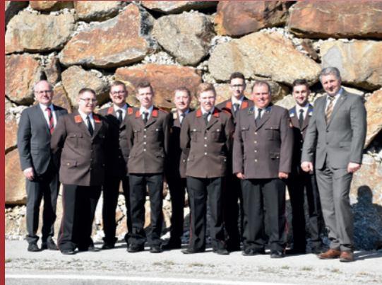
Mitgliederversammlung 27. März 2022