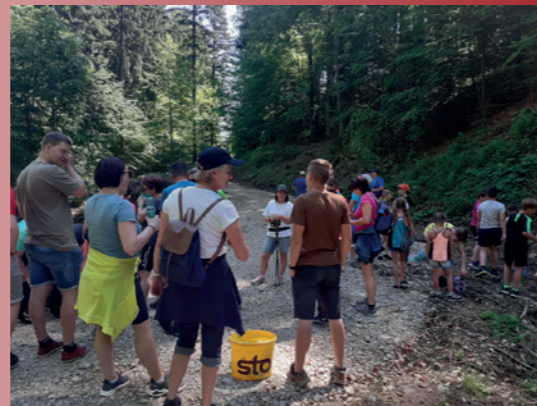
Familienwandertag 15. Mai 2022