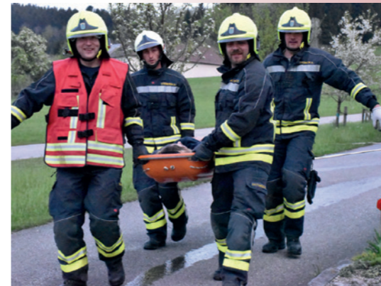
100 Jahr Übung mit FF St. Georgen/Klaus 29. April 2022