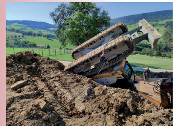
Fahrzeugbergung 10. August 2022