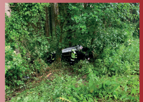
Fahrzeugbergung 7. Juni 2022