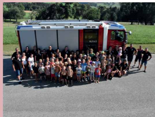
Ferienprogramm 25. Juli 2022