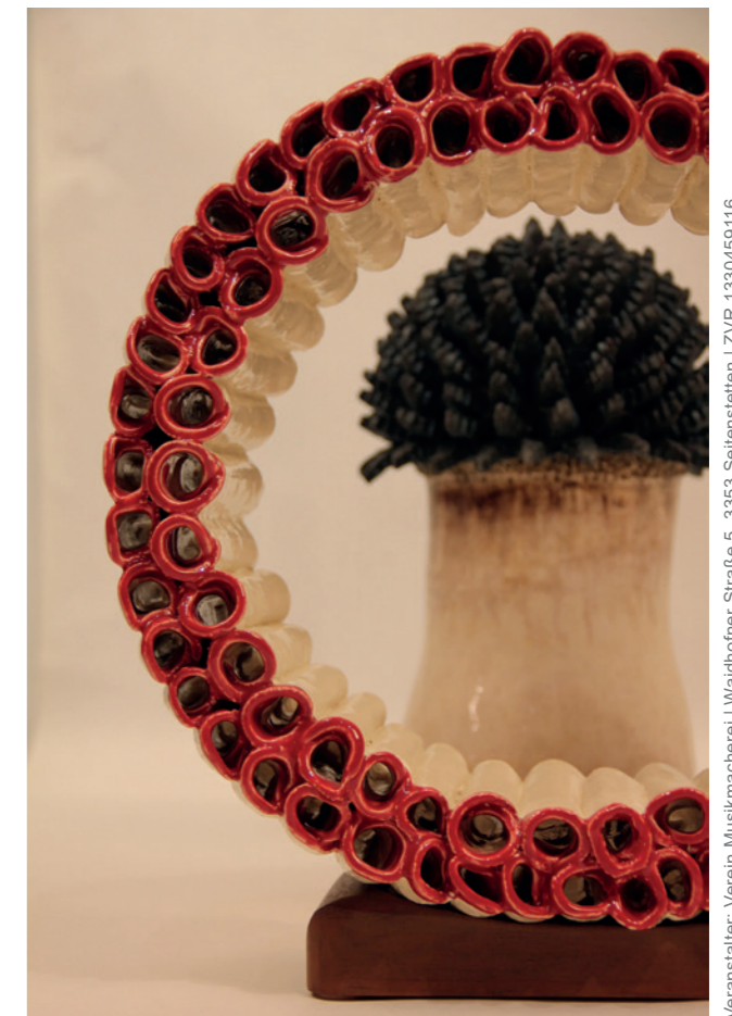
Veranstalter: Verein Musikmacherei | Waidhofer Straße 5, 3353 Seitenstetten | ZVR 1330459116