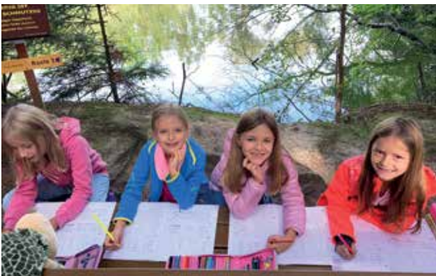
Beim Lernen im Wald waren die Schüler und Schülerinnen mit großer Begeisterung dabei.

Um „Zukunft“ gewährleisten zu können, ist es essentiell auch schon in jungen Jahren über den Nachhaltigkeitsgedanken und alles, was damit einher geht aufzuklären. Draußen unterrichten bzw. draußen lernen hat vielfältige positive Wirkungen auf Kompetenzerwerb, Motivation und Gesundheit.