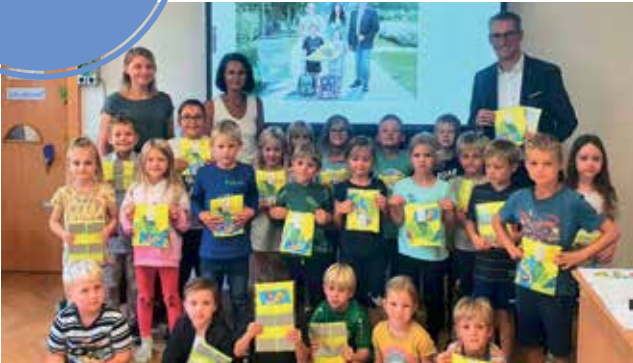
Bürgermeister Johannes Heuras besuchte die Volksschulen im Rahmen der Aktion „Schutzengel“.