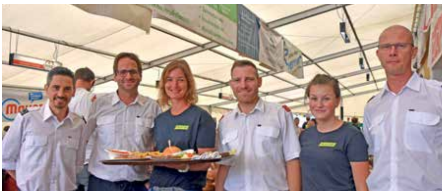
Das letzte Fest im alten Haus war zur Freude des Kommandos und den vielen fleißigen Helfern ein Erfolg.