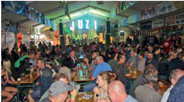
Die Freiwillige Feuerwehr St. Johann/Engstetten durfte sich wieder über ein volles Festzelt freuen.

Über ein äußerst erfolgreiches 3-Tages-Fest durfte sich die Freiwillige Feuerwehr St. Johann freuen. Volles Haus gab es sowohl am Freitag bei der Ö3-Disco, als auch am Samstag, an dem die „Jungen Zillertaler“ ein Garant für eine Bombenstimmung war. Der Sonntags-Frühschoppen mit dem Musikverein Wolfsbach und den Johannser Blechhölzern rundete die Veranstaltung ab, bei der auch für das leibliche Wohl wieder in bester Manier gesorgt war.