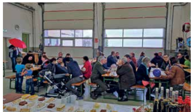
Im Feuerwehrhaus wurden die für den Bauernkirtag produzierten Schmankerl zum Verkauf angeboten.

Wind und starke Regengüsse machten es am 2. Oktober unmöglich, den St. Michaeler Bauernkirtag durchzuführen, weshalb die Veranstaltung am Vortag abgesagt wurde. Die Veranstalter hatten jedoch schon zahlreiche Schmankerl – Mehlspeisen, Speckbrote, etc. – vorbereitet, die im Feuerwehrhaus zum Verkauf angeboten wurden.