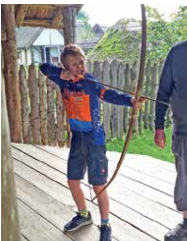
Im Keltendorf Mitterkirchen durften die Schüler ihr Können mit Pfeil und Bogen unter Beweis stellen.

Die anderen Klassen nutzten einen dieser Tage für die durch Corona lange verschobene Exkursion zum Erzberg (3. Klassen), einen Tag im Keltendorf Mitterkirchen (2. Klassen) bzw. zum Kennenlernen der landwirtschaftlichen Fachschule Gießhübl (4. Klassen).