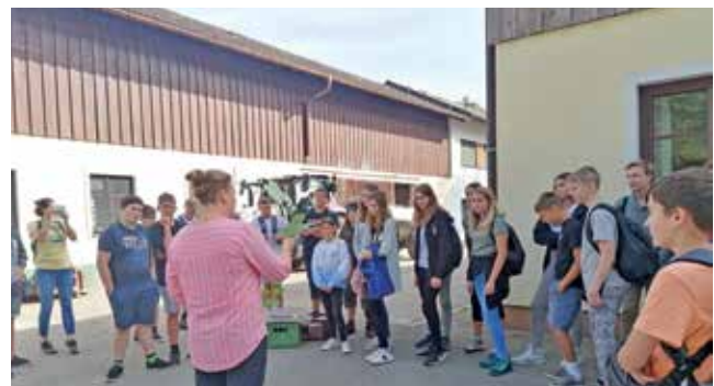
Die 4. Klassen lernten die Landwirtschaftliche Fachschule in Gießhübl kennen.

Mit 53 Neuanfänger*innen konnten drei erste Klassen gebildet werden. Gleich in der zweiten Schulwoche verbrachten die Kinder mit ihren Lehrer*innen Kennenlertage in Weyer. Bei zahlreichen Outdoor-Aktivitäten, Gruppenspielen und Teamfindungsaufgaben wurde der Grundstein für gute Klassengemeinschaften gelegt.