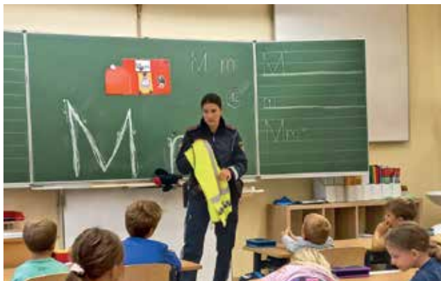
Sicherheit am Schulweg wurde in Kooperation mit der Polizei St. Peter/Au thematisiert.

Kindergartenkinder sicher in der Schule bzw. im Kindergarten ankommen und anschließend auch wieder unversehrt nach Hause kommen.