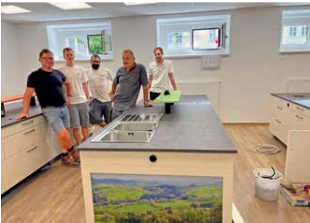
Die neue Schulküche ist nicht nur mit allen technischen Möglichkeiten für den Kochunterricht ausgestattet, sondern auch ein richtiger Hingucker geworden.

Schülerinnen und Schüler und natürlich auch das Lehrpersonal sind begeistert von den neuen Möglichkeiten. Ganz herzlicher Dank gilt den beiden Schulgemeinden für diese zukunftsweisenden Investitionen.