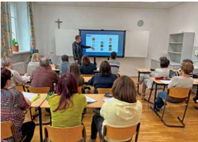
Alle Lehrer erhielten eine Einschulung an der digitalen Schultafel, die interaktiven Unterricht möglich macht.