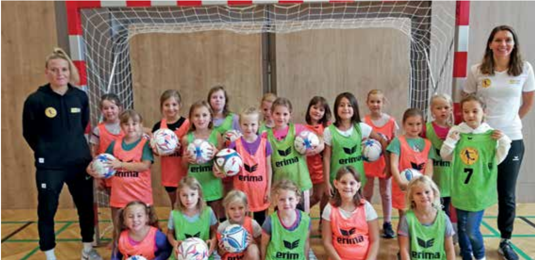
Die Profi-Fußballtrainerinnen gestalteten einen kurzweiligen Vormittag.

So fanden im Rahmen des regulären Sportunterrichts für alle Mädchen der 1. bis 4. Schulstufe aus St. Peter/Au fußballspezifische Bewegungseinheiten mit Profi-Fußballspielerinnen statt. Die Mädchen waren jedenfalls mit großer Begeisterung bei der Sache!