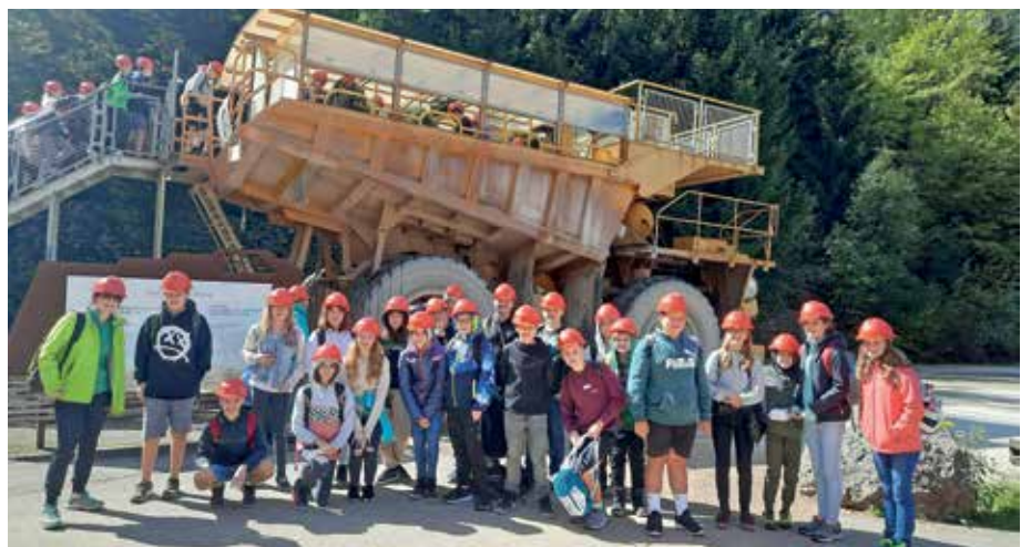
Nach oftmaligen Verschiebungen konnten die dritten Klassen einen spannenden, actionreichen und informativen Tag am Erzberg erleben.