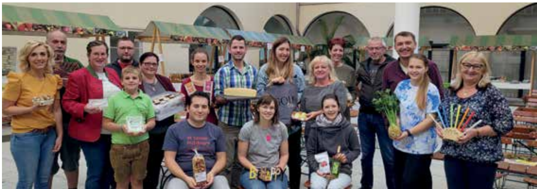
15 Produzenten aus St. Peter und Umgebung boten ihre Produkte beim Genussfest im Schloss an.