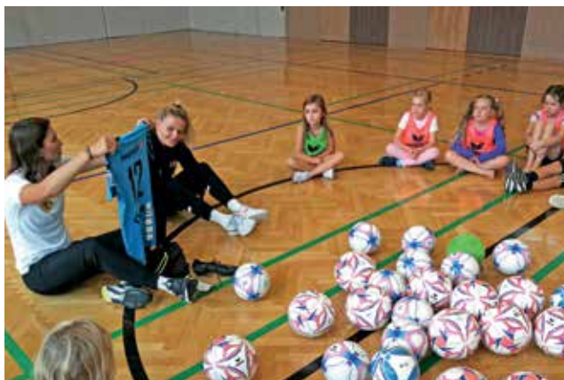
Den Mädels machte das Fußballtraining mit den Trainerinnen riesigen Spaß.

Wie jedes Jahr zum Schulanfang besuchte der Herr Bürgermeister im Rahmen der „Aktion Schutzengel“ alle Tafelklassen. In den ersten beiden Schulwochen erklärten sich auch heuer Eltern aus St. Peter als Schülerlotsen bereit, um den Verkehr im Bereich Adeg – Beranek – Feuerwehrhaus zu regeln und die Schüler sicher über den Schutzweg zu geleiten.