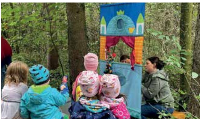
Auch der Kasperl kam mit seinem Freund Pezi ins Burgholz und sorgte für strahlende Kinderaugen.

Gemeinsam mit Vereinen, Firmen, der Gesunden Gemeinde und dem Roten Kreuz fand in und um das Burgholz eine Erlebniswanderung für Groß und Klein statt. Am Programm standen zahlreiche Infos rund ums Wohlfühlen in der Natur sowie Waldführungen. Eine Labstelle war beim Roten Kreuz eingerichtet, wo später die Fahrzeugsegnung stattfand.