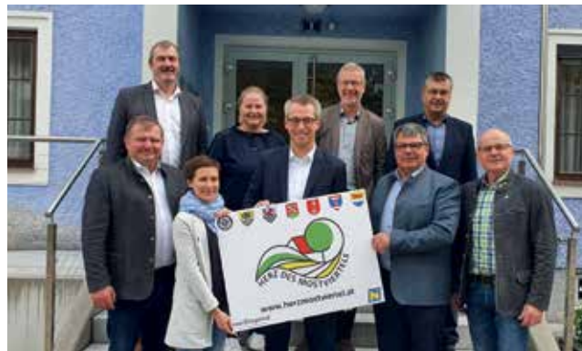
Die Gemeindevertreter der Kleinregion Herz des Mostviertels ziehen an einem Strang.

Gemeinsam besprochen und diskutiert wurden, die aktuelle Situation