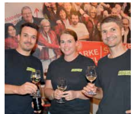
Edle Tropfen wurden in der Weinbar geboten.