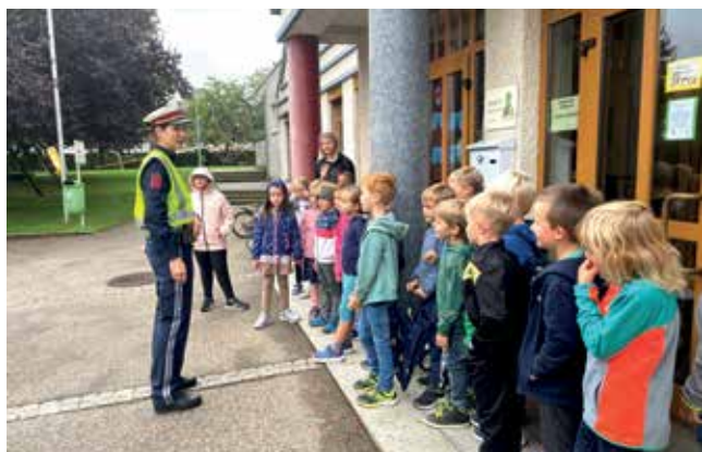
Aufmerksam hörten die Kinder zu, was sie bei ihrem Schulweg beachten müssen.

Die AKTION SCHUTZENGELE des Sicherheitsforums NÖ hat heuer bereits zum 23. Mal stattgefunden. Ziel der Aktion ist es, mit Plakaten und Werbeschaltungen für jedes Kind die Aufmerksamkeit im Straßenverkehr zu erhöhen. Damit wird ein Beitrag geleistet, dass knapp 126.000 NÖ Schul- und