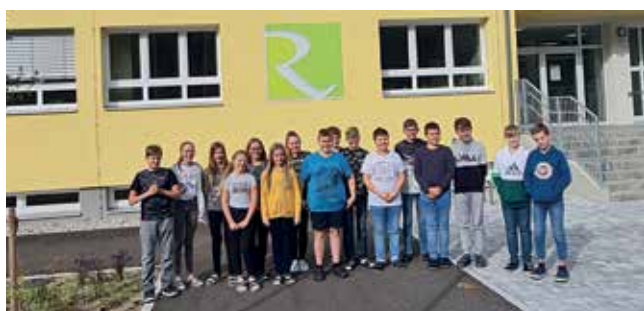
Die Schüler der 3a-Klasse laden stellvertretend für die ganze Schue zum großen Schulfest ein!

Zwei Jahre lang wurde das in die Jahre gekommene Schulhaus zu einem modernen Schulzentrum umgebaut. Das Ergebnis kann sich sehen lassen und die Freude bei Schülern, Eltern und Lehrern über die „neue“ Schule ist groß! Am Freitag, 14. Oktober, veranstaltet die Schule zum Eröffnungsfest mit „Tag der offenen Tür“, zu dem auch alle Bürgerinnen und Bürger herzlich geladen sind.