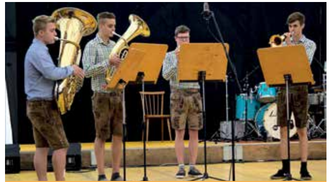
Der Nachwuchs der Trachtenmusikkapelle St. Michael, die Gruppe „Berg Bech“, überzeugte auf ganzer Linie.

Trotz des schlechten Wetters durften sich die Musik und Feuerwehr St. Michael über ein volles Zelt freuen. Beim Dämmerchoppen am Samstag sorgten der Musikverein St. Peter/Au sowie die Gruppe „Echt Böhmisches“ für Stimmung. Am Sonntag stand das Bezirksweisenblasen am Programm, bei dem insgesamt 22 Musikvereine aus dem Bezirk in Gruppen von je drei bis sechs Personen teilnahmen. Den Besuchern wurde Blasmusik in Perfektion geboten.