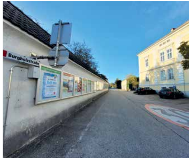
Die Burgholzstraße ist die nächste Station der umfassenden Infrastruktur-Maßnahmen in St. Peter/Au.