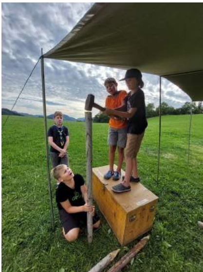
Sommerlager in Reinsberg

Im August verbrachten die Pfadfindergruppen Hollenstein und Ybbsitz gemeinsam das Sommerlager in Reinsberg. Die Wichtel und Wölflinge hatten auf ihrer Burg jede Menge Aufgaben zu lösen und die Guides und Späher bauten ein Lager und absolvierten ihre Ritterausbildung in Zelten. Am Ende des Lagers wurden die Guides und Späher dann auch verdientermaßen zum Ritter geschlagen und konnten stolz auf ihre Leistungen, die Heimreise in die Zivilisation antreten. Die Pfadfindergruppe bedankt sich beim gesamten Leiter- und Helferteam und besonders bei Fa. Aigner Bodenpersonal für den Materialtransport.