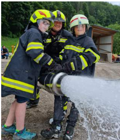
Gestern Schule - Heute Helden im Einsatz mit den Mitgliedern der Freiwilligen Feuerwehr Ybbsitz.

Die Marktgemeinde Ybbsitz bot in den heurigen Sommerferien für alle Ybbsitzer Kinder ein tolles Ferienprogramm an.