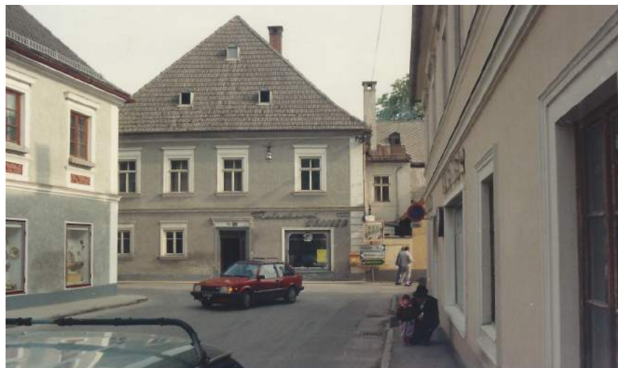
Um 1988 - Hafnerkreuzung