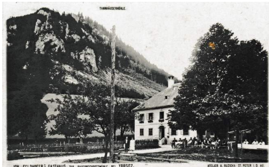
Um 1950 - Bauernschrottmühle

Jeden 1. Donnerstag im Monat von 9.00 Uhr bis 11.00 Uhr sind die Topothekare für Sie am Gemeindeamt da.