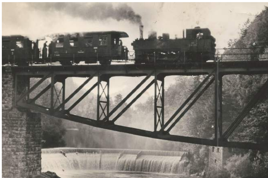
Um 1960 - Ybbstalbahn 1960