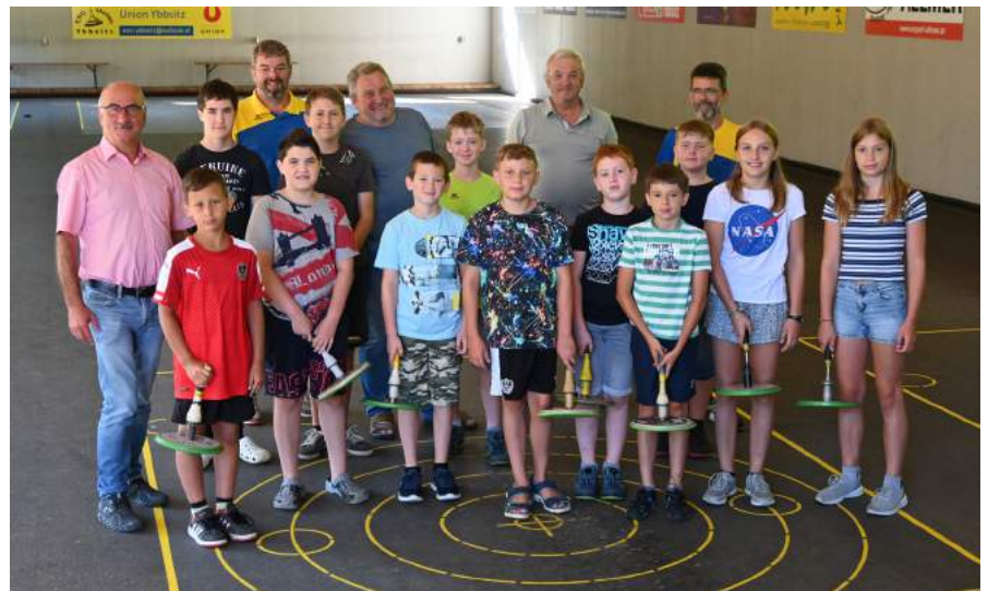
Die Sektion Stockschißen nützte das Ferienprogramm um den Jugendlichen den Stocksport näher zu bringen.