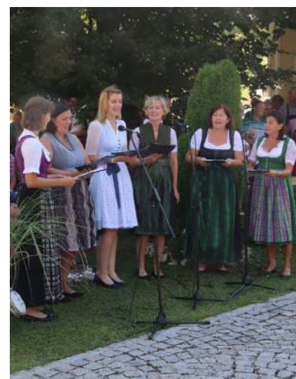
Das Ensemble „Lyra“ untermalte den Festakt musikalisch.