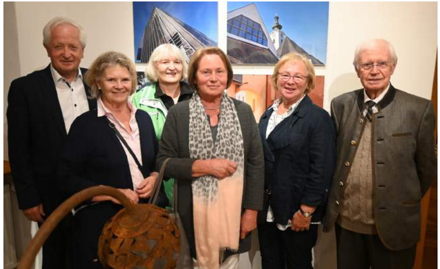
Die Ausstellung des Fotoklub Ybbsitz lockte zahlreiche Besucher in das FeRRUM.

Die Enthüllung der im Rahmen eines Workshops beim Schmiedefest Ferraculum geschaffenen Skulptur „Transformation“ nach Entwürfen und unter Anleitung des italienischen Künstlers Roberto Giordani auf ihrem