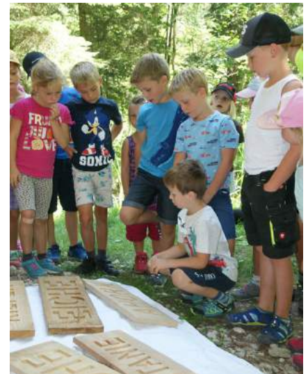
Wald erleben mit der Waldspielgruppe Wurzelkinder