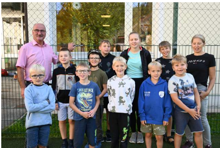
Die Ferienbetreuung in der Volksschule Ybbsitz wurde über die ganzen Ferien hinweg angeboten und auch sehr gut angenommen.

kocht und natürlich verkostet. Die Marktgemeinde Ybbsitz wünscht allen Eltern und Schulkindern einen guten Schulstart!