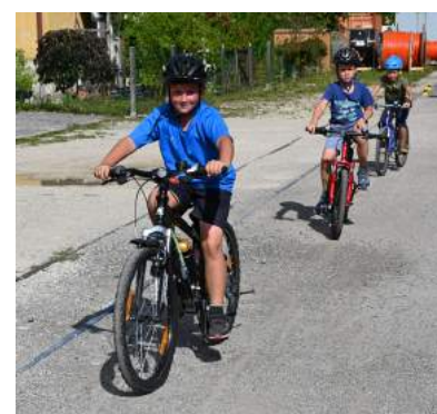
Kostenloser Sommer-Radkurs für die Volksschüler.