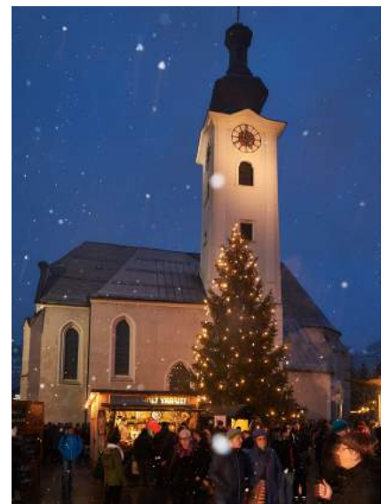
Ybbsitzer Schmiedeweihnacht

Die Marktgemeinde Ybbsitz lädt heuer wieder zur Schmiedeweihnacht von Samstag, 17. Dez. bis Sonntag 18. Dezember 2022 ein. Das genaue Programm folgt zeitgerecht unter www.ybbsitz.at .