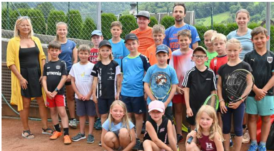
Der Schnuppertag am Tennisplatz durch den Tennisclub K1 begeisterte die jungen Tennisspielerinnen und Tennisspieler.

Durch den Einsatz von zahlreichen örtlichen Vereinen und Institutionen wie der Freiwilligen Feuerwehr, Tennisclub K1 Ybbsitz, Waldspielgruppe Wurzelkinder, Volkstanzgruppe und Landjugend, den Union Stockschützen, ÖAAB Ybbsitz,