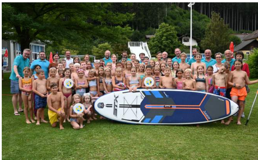
Das Nachtbaden des ÖAAB Ybbsitz im Freibad begeistert jedes Jahr eine große Zahl an Kindern.