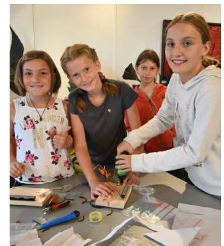
Tricks und Zaubereien im Rahmen des summerncamp-4-kids der Zukunftsakademie Mostviertel.