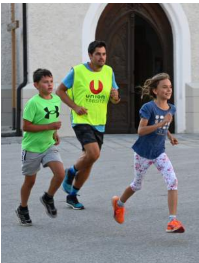
Union - Kinderlaufträng.