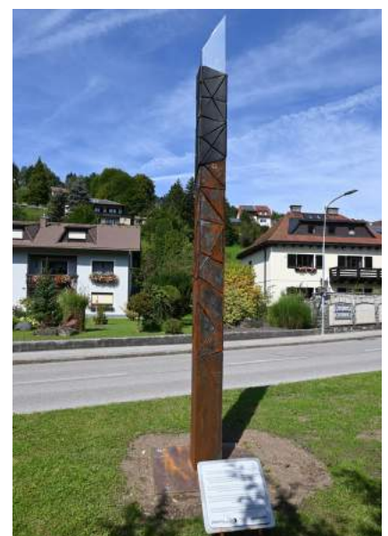
Neu installierte Skulptur „transformation“

Im Rahmen eines feierlichen Abschlusses der Ausstellungen