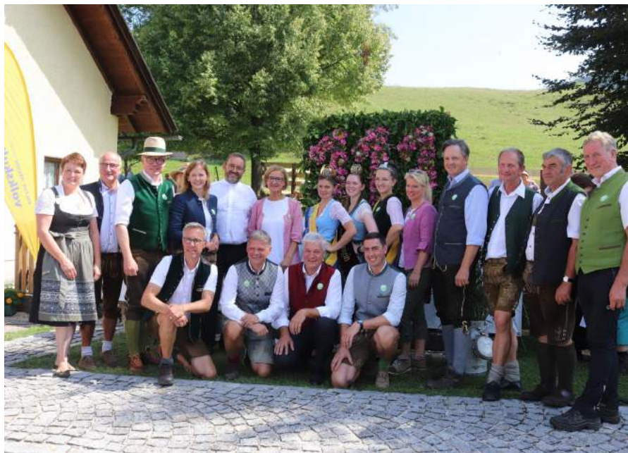
Landeshauptfrau Johanna Mikl-Leitner und Staatssekretärin Claudia Plakolm mit Vertretern des Bundes und Landes NÖ sowie der Landwirtschaftskammer und des Weidevereines.