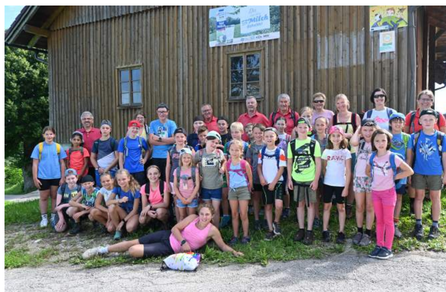
Mitglieder des Alpenvereines Ortsgruppe Ybbsitz machten mit den Kindern eine Wanderung auf den Prochenberg.