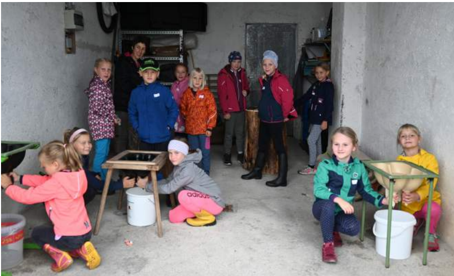
Spiel & Spaß am Bauernhof durch die Ybbsitzer Bäuerinnen am Hof „Ober-Hubegg“ war trotz schlechtem Wetter ein großer Erfolg.