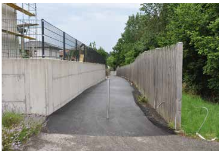
Neu asphaltierter Geh- und Verbindungsweg von der Schulstraße in den Südhang