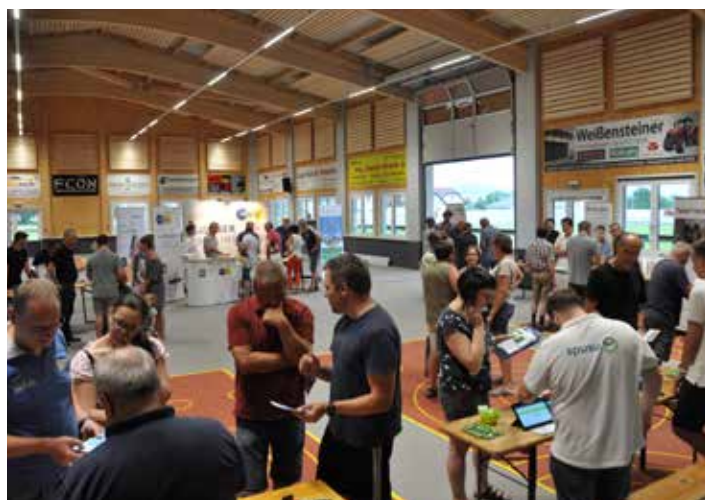
Gut besuchte Glasfasermesse im Sportzentrum