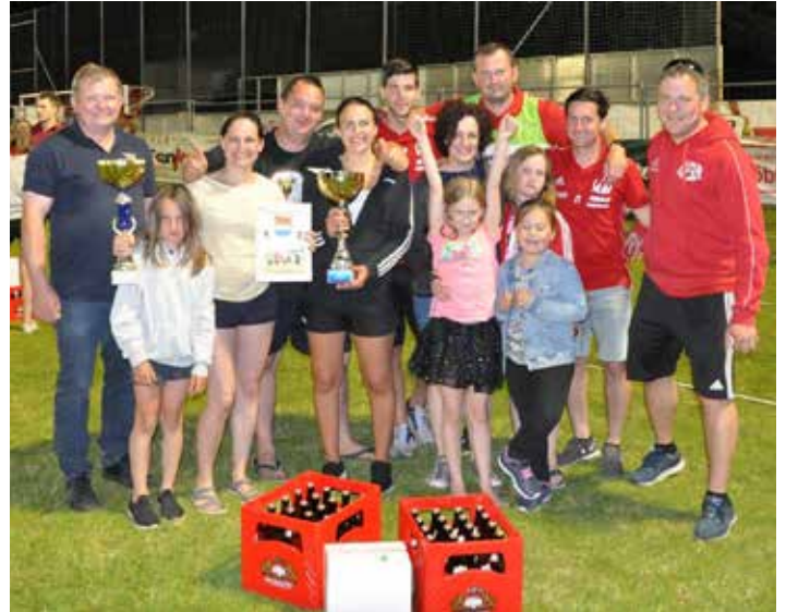
Siegerfoto Völkerballturnier mit den Goidhaum

Am Abend wurde dann die zweite Auflage des Völkerballturniers gespielt. 12 Mannschaften kämpften heuer um den Turniersieg, welchen sich die „Goidhaum“ in einem sehr spannenden Finale gegen die Gruppe „Tennis“ sichern konnten.