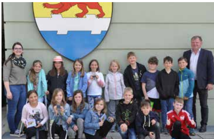
Besuch der beiden 3. VS Klassen am Gemeindeamt