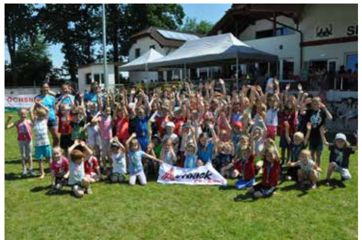
Gruppenfoto Kinderlauf veranstaltet durch den LSC

Auch am Sonntag versorgte die Sektion Fußball der SU Wolfsbach die Zuschauer vom Kinderlauf des LSC Wolfsbach mit Speis und Trank.