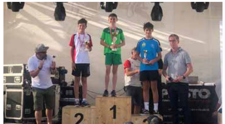
Bericht: Rene Stöger