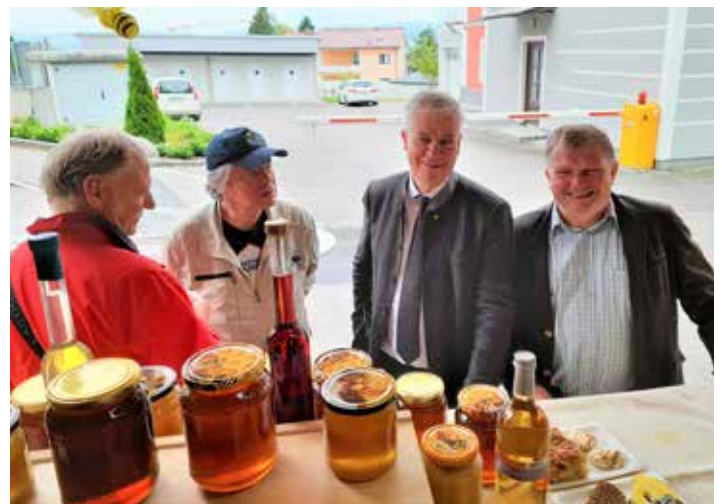
Auf dem Foto: Politik-Prominenz zu Besuch am Imkerstand beim Wolfsbacher Kirtag

Das Bienenjahr geht ja schon wieder langsam zu Ende! Das heurige Jahr dürfte für viele Imkerinnen und Imker reichlich frischen Honig bringen. Die Bienen haben heuer, vermutlich durch das warme Wetter, reichlich Nektar eingetragen und zu frischem Honig verarbeitet. Er steht bereit für alle, die dieses reine Naturprodukt genießen wollen.