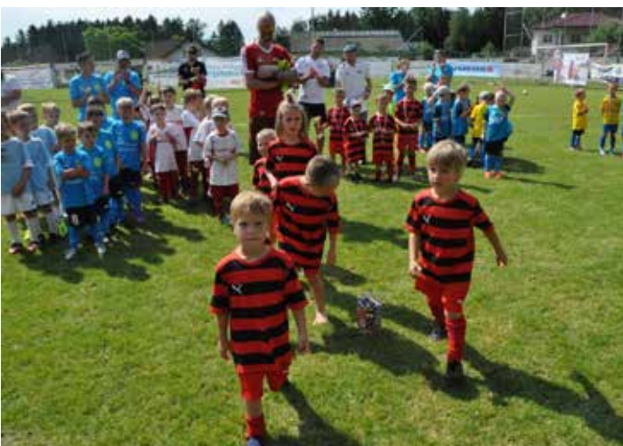
Erster Einsatz der Bambinis (U6 Mannschaft)

Besonders war, dass heuer auch die „Stars von morgen“, unsere Bambinis (U6), in den Turnieren vertreten waren. In Sachen Ehrgeiz standen die jungen Kicker ihren älteren Kollegen nichts nach und so war auch dieses Turnier sehr sehenswert. Im Anschluss konnten die letzten Kräfte noch in der Hüpfburg aufgebraucht werden.