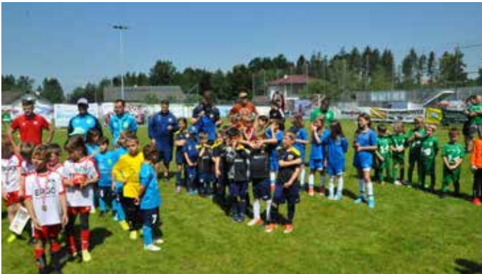
Siegerehrung der U9 Mannschaft

Das „Hauptprogramm“ stand dann aber am Samstag auf dem Programm. Von 8:30 bis 15:00 spielten 34 Jugendmannschaften (rund 300 Kinder) aus der Umgebung in den Altersklassen U7 bis U10 um heiß begehrte Trophäen.