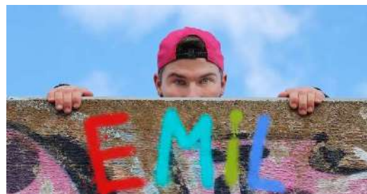
Emil und die Detektive

Heuer gibt es wieder ein großes Kinderstück mit Musik: Der Kinderbuch-Klassiker von Erich Kästner EMIL UND DIE DETEKTIVE steht am 23. und 30. Oktober auf dem Programm. Mit dabei sind 22 Kinder der Musikmittelschule Blindenmarkt. Die Begeisterung auf allen Seiten ist groß! Wir bedanken uns schon jetzt beim Lehrerteam und den jungen DarstellerInnen für die gute Zusammenarbeit.