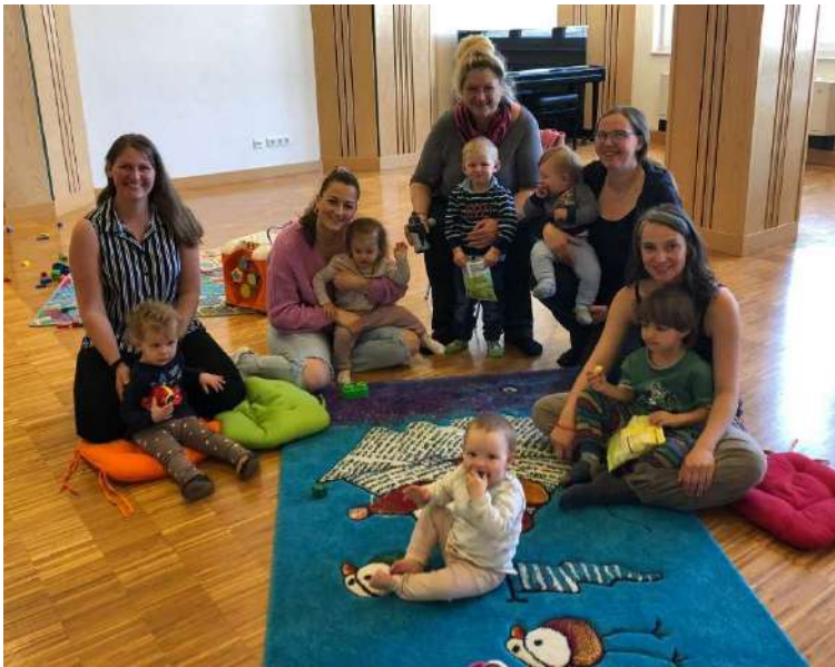
Mamas und Oma mit ihren Kindern und Enkeln