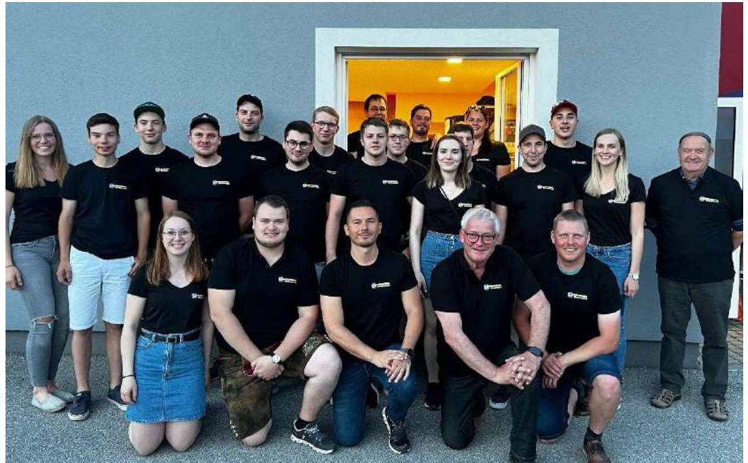
Ein großes Dankeschön an die VP Blindenmarkt, welche die Hälfte der T-Shirt Kosten übernahm.