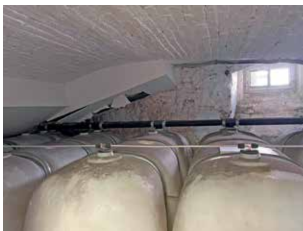
Die alten Öl-Tanks im Kindergarten St. Michael sind bald Geschichte. Im Sommer werden die Heizungsanlagen in Kürnberg und St. Michael auf neue und klimafreundlichere Beine gestellt.