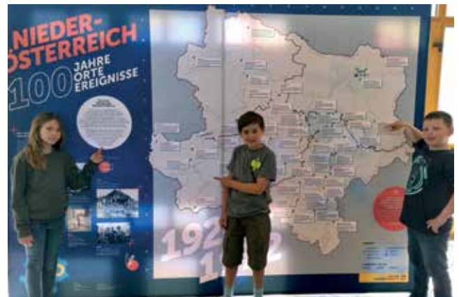
Viel Wissenswertes rund um unser Bundesland Niederösterreich erfuhren die Schüler im Rahmen der Wanderausstellung zum 100. Landesjubiläum.

Schüler können dabei wichtige Eckpunkte dieser Erfolgsgeschichte erkunden. Die Entdeckungsreise führt zu historischen Schauplätzen, zu Museen und Gedenkstätten im ganzen Land. Es soll Wissen und Zeitgeschichte rund um NÖ vermittelt werden.