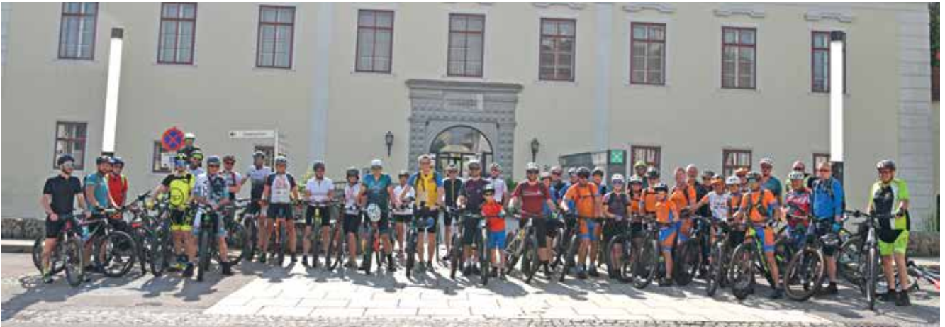
Vom Treffpunkt im Schloss aus wurde die rund 70 Kilometer lange Route durchs Gemeindegebiet gestartet.

Im Rahmen der Aktion „Grenzerfahrung“ anlässlich 50 Jahre Gemeinde St. Peter/Au wurden die Gemeindegrenzen erradelt.