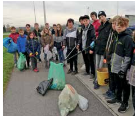
Als fleißige Müllsammler waren die Schüler ebenfalls unterwegs.

Ob Müllsammeln, klimafreundliche Jause, Herstellen von Naturkosmetik und Stoffsackerln, Bauen von Insektenhotels oder aber Bäume pflanzen – die Schülerinnen und Schüler waren mit vollem Engagement und großer Begeisterung bei der Sache. Ein Imker in Weistrach wurde besucht und in einer Bäckerei wurde Biogebäck gebacken. Der Forschergeist wurde bei der chemischen Wasseranalyse oder aber beim Bauen von Solarmodellen geweckt. Auch eine Umfrage im Markt zum Thema „Wie klimafreundlich ist die Gemeinde“ wurde von den Kindern durchgeführt.