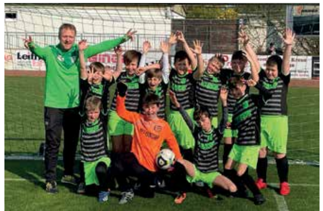
Auch das Team der VS St. Peter/Au hatte jede Menge Spaß.