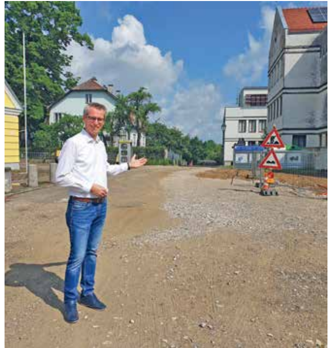
Im Bereich der Mittelschule wird ein erhöhtes Gehsteig errichtet. Auch eine Querungshilfe wird mit farbiger Bodenmarkierung geschaffen.

Da sich schlussendlich auch die EVN entschlossen hat, einen Transformator zu erneuern, wurde das gesamte Unterfangen, welches durch die Firma Strabag umgesetzt wird, noch langwieriger. Bürgermeister Heuras führt aus: „So eine Baustelle ist natürlich wahrlich eine Belastungsprobe für die betroffenen Anrainer und ich bedanke mich wirklich für ihr Verständnis und ihre Geduld bisher. Jetzt geht es aber in die Schlussphase!“ Wenn die Leistensteine aus Granit gesetzt sind und die Straße wieder frisch asphaltiert ist, dann wird im Bereich der Mittelschule auch wieder für eine entsprechende Begrünung gesorgt.