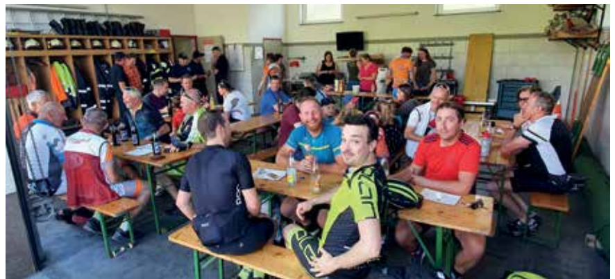
Auch das Gesellige kam nicht zu kurz. Die Grenzradler wurden von der FF Hochstraß und dem Musikverein St. Michael kulinarisch verwöhnt.

07477 42111-DW 10 oder DW 11 oder gemeinde@stpeterau.at