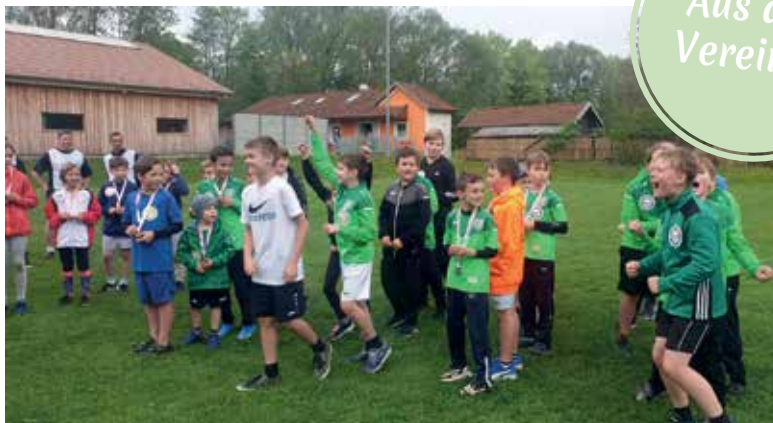
Der Fussball-Nachwuchs aus St. Peter präsentierte sich beim „Beweg dich schlau-Qualifier Event“ von seiner besten Seite.

Die Initiative von ServusTV in Zusammenarbeit mit Felix Neureuther begeistert viele Vereine und auch der UFC hat sich angemeldet und teilgenommen. Sechs Teams mit insgesamt 36 Kindern trainierten für den Event und zeigten vor den ServusTV-Juroren vollen Einsatz um die Punkte. Beim Qualifier Event in St. Peter holten sich „Die schnellen Bubis“ knapp vor den „Herbstmeistern“ die meisten Punkte und qualifizierten sich somit für das Landesfinale.