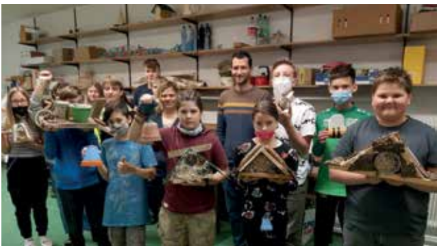
Eine Gruppe bastelte verschiedenste Insektenhotels.

Die Schüler machten sich in weiterer Folge Gedanken, wie sie ihre eigene Umgebung klimafreundlicher und schöner gestalten könnten. Daraus ist die Idee zum Projekttag gewachsen, bei dem alle Lehrerinnen und Lehrer Workshops im Stationenbetrieb ausgearbeitet haben.