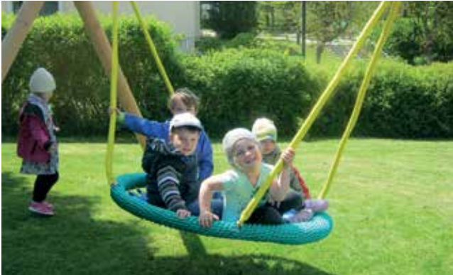
Die Kinder im Kindergarten St. Peter/Au-Markt genießen das vielfältige Bewegungsangebot in vollen Zügen.