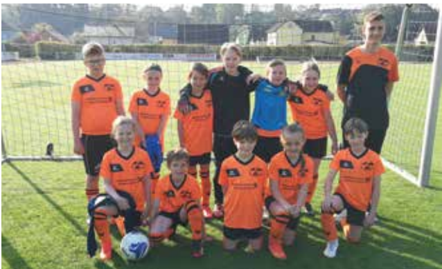
Das Fußball-Team aus Kürnberg schlug sich beim Sumsi Erima Kids Cup wacker.