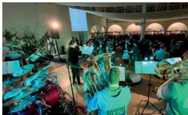
Für Bombenstimmung am Mittwochabend sorgte im Schlosshof die Gruppe „absolut BLECH“, während DJ Ernesto die Foyerbar zum Kochen brachte.

Natürlich war auch für das leibliche Wohl mit köstlichen Henderln, Musik-Bürgern, Mehlspeisen und Co gesorgt.