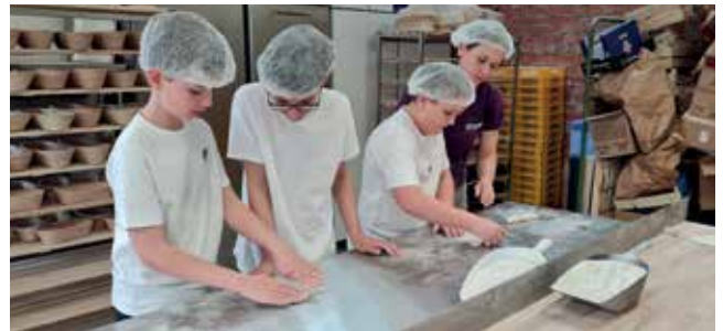
In der Bäckerei Schaupp stellten die Schüler Bio-Gebäck her.