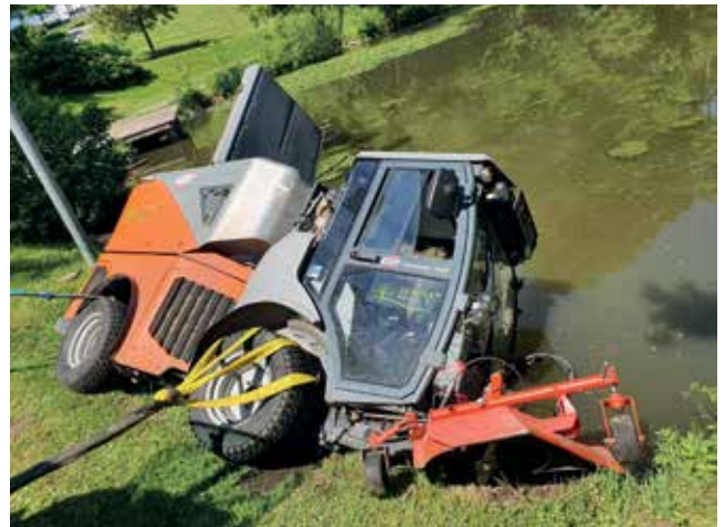
Das Fahrzeug rutschte auf weichem Untergrund in den Schlossteich.

Ob an der Maschine ein Schaden entstanden ist, wird derzeit bei der Herstellerfirma in Salzburg durchgecheckt. Wir hoffen natürlich, dass kein Wassereintritt in die Motorteile erfolgt ist. So oder so ist es am wichtigsten, dass dabei niemanden etwas passiert ist. Alles andere lässt sich ersetzen. Aber es ist wohl eine Geschichte, über die wir auch in ein paar Jahren noch sprechen werden.