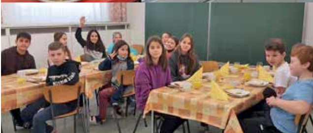
Gemeinsam wurde im Unterricht ein britisches Frühstück zubereitet und genossen.