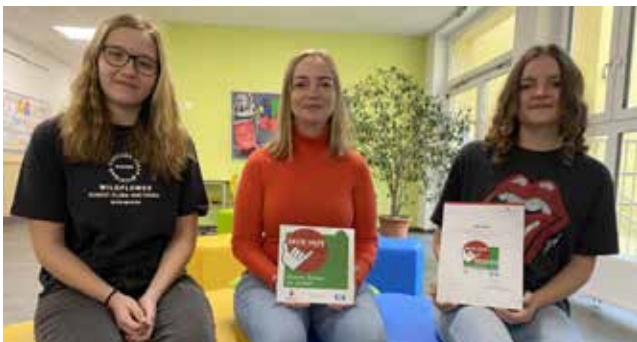
Die Schüler der NÖMS Ramingtal sind Erste- Hilfe-FIT.

Nahezu alle Schülerinnen und Schüler der vierten Klassen absolvierten einen 16-stündigen Erste-Hilfe-Kurs und sind dadurch für den Ernstfall bestens gewappnet. Auch das Lehrerteam ist für etwaige Notfälle geschult.