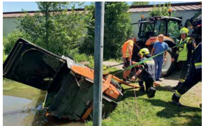
Gemeinsam mit der Freiwilligen Feuerwehr St. Peter/Au wurde das Fahrzeug geborgen.