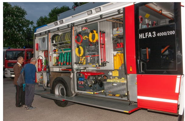
Foto: mit dem neuen HLF 3 ist die Feuerwehr bestens für technische Einsätze und für die Brandbekämpfung ausgerüstet