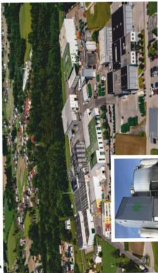
Luftbild vom Werksgelände der Austria Juice und der betrieblichen, vollbiologischen Abwasserreinigungsanlage in Krollendorf