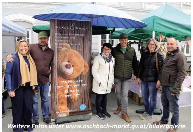
Weitere Fotos unter www.aschbach-markt.gv.at/bildergalerie