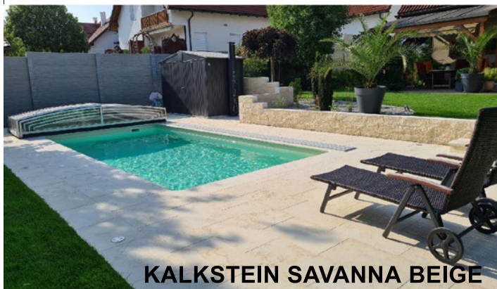
KALKSTEIN SAVANNA BEIGE