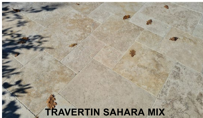
TRAVERTIN SAHARA MIX