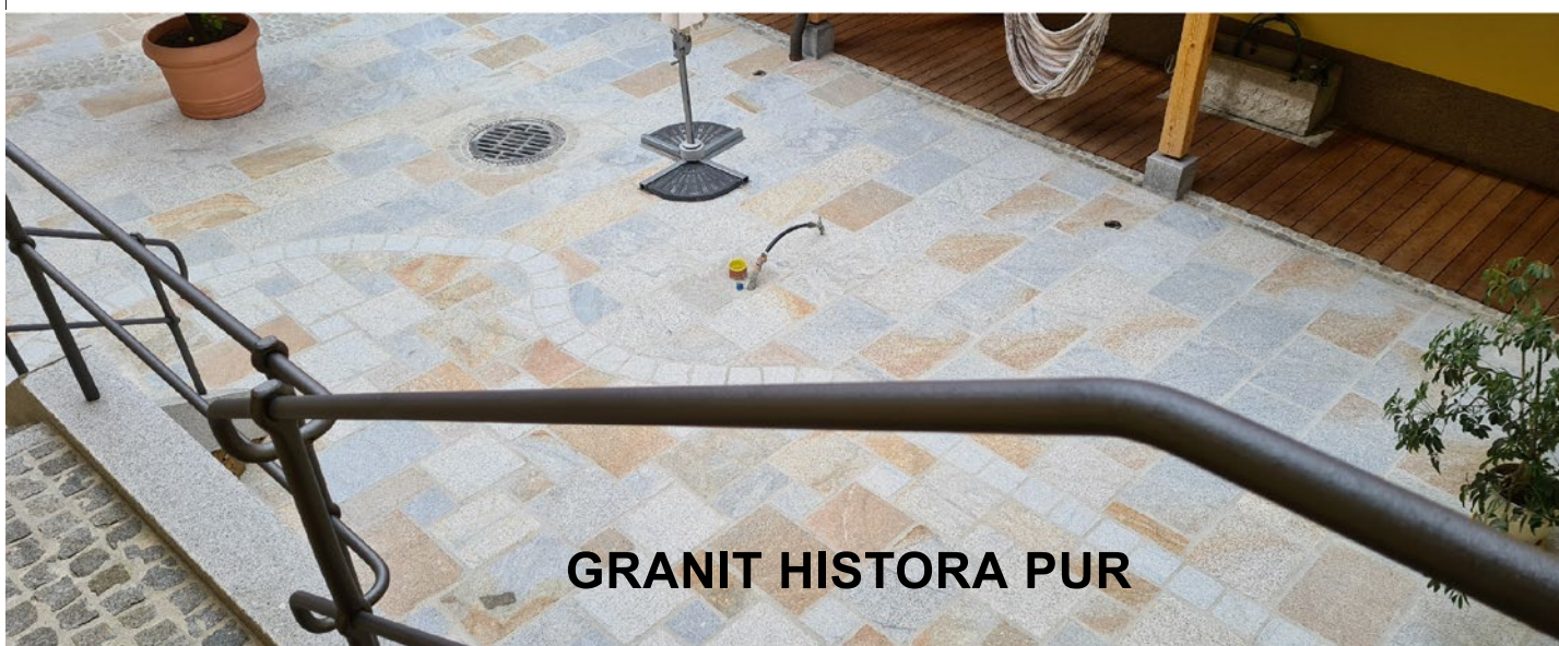
GRANIT HISTORA PUR

NEUE KERAMIK UND FEINSTEINZEUG KOLLEKTION 2022