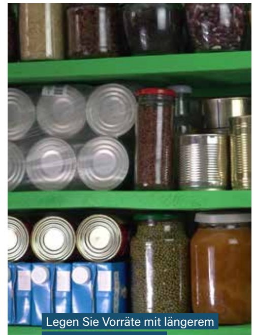
Legen Sie Vorräte mit längerem Haltbarkeitsdatum an.

Infos für die richtige Bevorratung erhalten Sie beim Zivilschutzbeauftragten Ihrer Gemeinde oder beim Niederösterreichischen Zivilschutzverband NÖZSV : Tel. 02272 / 61820 noezsv@noezsv.at