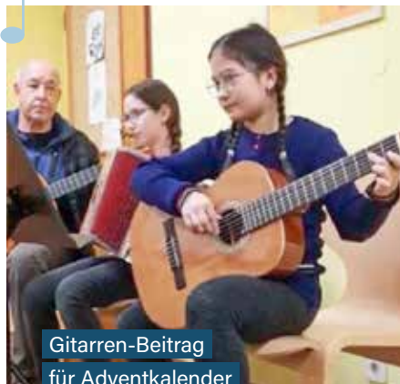
Gitarren-Beitrag für Adventkalender

Neu- anmeldungen für das Schuljahr 2022/23 sind vom 19. April bis 31. Mai möglich.