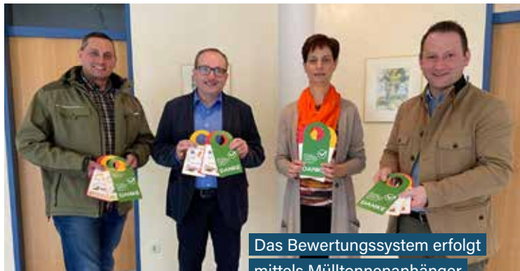
Das Bewertungssystem erfolgt mittels Mülltonnenanhänger

Der Gemeindeverband für Umweltschutz und Abgabeneinhebung im Bezirk Scheibbs, kurz GVU, setzt seit Jahresbeginn ein Ampel-Bewertungssystem um. Unter dem Pseudonym „Apfelburzen-Razzia“ werden in erster Linie die Biotonnen direkt bei der Abholung bewertet. Das erklärte Ziel: eine bessere Trennqualität bei Bioabfall und Restmüll.