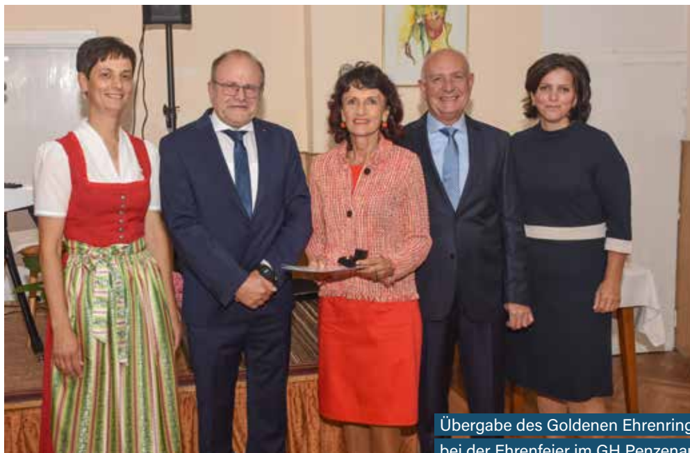
Übergabe des Goldenen Ehrenrings bei der Ehrenfeier im GH Penzenauer

Goldener Ehrenring für ehemalige Amtsleiterin nach 44-jähriger Tätigkeit im Gemeindeamt