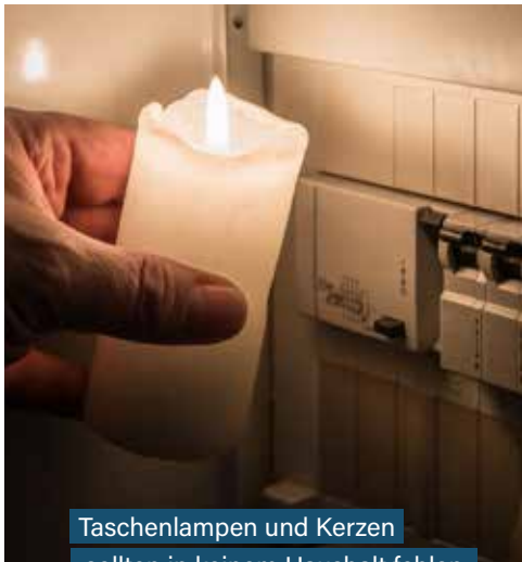
Taschenlampen und Kerzen sollten in keinem Haushalt fehlen.

Seit die Kämpfe in der Ukraine begonnen haben, haben viele Menschen in Niederösterreich Sorge um ihre Sicherheit. Sorge um die Versorgung, die Gesundheit, die Familie. Das ist nur allzu verständlich. Und sich Gedanken machen ist auch gut. Angst haben ist schlecht, und für Angst besteht auch kein Grund. Mit Vorsorge und Vorrat sind Sie für die meisten Probleme – auch im Zusammenhang mit der Ukraine-Krise – gerüstet.