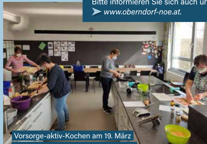
Vorsorge-aktiv-Kochen am 19. März in der Schulküche der MS Oberndorf

Bitte informieren Sie sich auch unter www.oberndorf-noe.at .