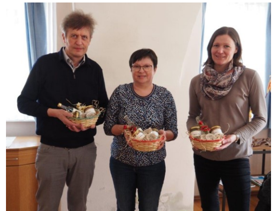
Nicht auf dem Bild: Harald Kronberger

Vielen Dank dem Wahlvorstand für die ausgezeichnete Vorbereitung und Durchführung der Wahl!