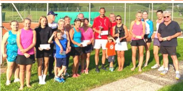
Foto oben links: Abschluss Kids und Jugend Foto oben rechts: Tenniscamp Sommerferien Foto links: Doppeltturnier