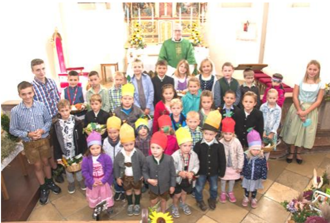
Erntedankfest am 03. Oktober