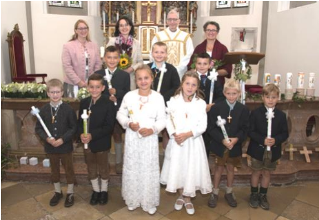
Am 28. August wurde die Erstkommunion gefeiert und 9 Kinder unserer Volksschule konnten von