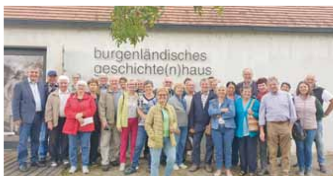
Foto: 33 Mitglieder nahmen an der 5-Tages-Ausfahrt des Seniorenbundes Ardagger Stift ins Südburgenland teil.

Uhudler wurde natürlich auch verkostet. Mit dabei waren 33 Seniorenbundmitglieder und alle waren begeistert von der tollen Organisation der Reise und konnten viele neue und interessante Eindrücke mit nach Hause nehmen.