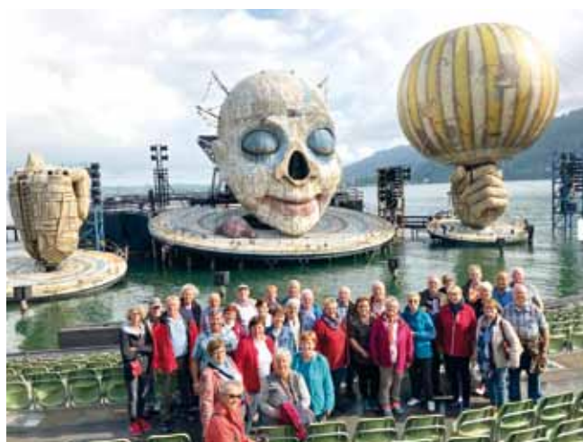
Foto: Die Stephansharter Senioren beim Ausflug, hier auf der Bregenzer Seebühne.