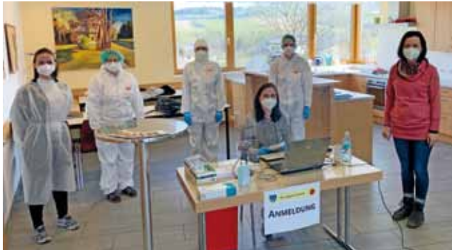
Foto: Mehr als 8.000 Covid19-Testungen wurden in der Teststraße Ardagger zw. Ende Jänner und Ende August durchgeführt.

Von 25. Jänner bis 30. August 2021 war in Ardagger eine amtliche Teststraße, um sich mittels Antigen-Schnelltest kostenlos testen zu lassen, installiert. Gestartet wurde im Jänner am Gemeindeamt und nach der großen Zunahme der Testungen wurde die Teststraße in den Pfarrhof Ardagger Stift verlegt. An dieser Stelle bedanken wir uns herzlich bei der Pfarre Ardagger Stift für die Möglichkeit, diesen Standort - der perfekt für diesen Zweck war - zu nutzen! Anhand der Zahlen sieht man die Bereitschaft der Bevölkerung: So wurden an stark frequentierten Tagen bis zu 350 Testungen an einem Tag durchgeführt. Insgesamt wurden mehr als 8.000 Tests seit