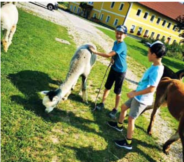
Foto: Die Alpakawanderung war ein besonderes Erlebnis im Rahmen der Ferienbetreuung.

Vielen Dank an Gudrun Sturl für das tolle Ferienprogramm auch im Namen der Kinder.