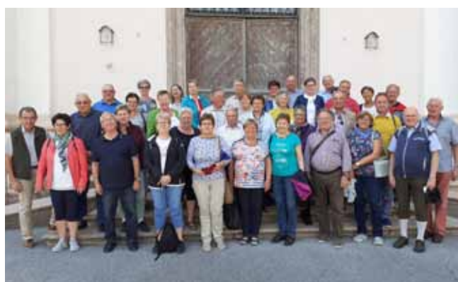
Foto: Die Seniorenbünde der Ortsgruppen Ardagger Markt und Kollmitzberg waren gemeinsam unterwegs.

Tage im Zillertal angesagt, wo die Senioren die Bergwelt (Zillergrund, Penken, Hintertux usw.) bestaunen konnten. Der Abschluss war eine Messe mit Pfarrer Bruder Stefan im Wallfahrtsort Maria Kirchentäl bei Lofer.