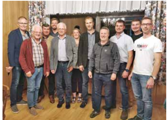
Foto: Das neu gewählte Vorstandsteam der Wassergenossenschaft Stephanshart.