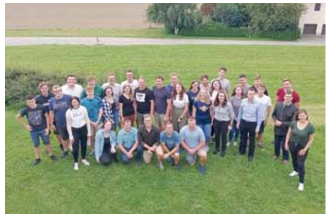
Foto: Die JVP Kollmitzberg bei der Jahreshauptversammlung.

Jahr an. Insofern bleibt momentan alles beim Alten und die Versammlung war eher eine „Standortbestimmung“ und ein Bericht des Obmannes über die bisherigen Aktivitäten und die Vorhaben.