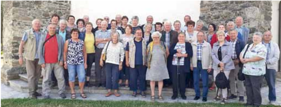
Foto: Der Seniorenbund Kollmitzberg beim Ausflug.

des Donaurundwanderweges in Luberegg, wo die Gruppe den Tag mit einem gemütlichen Abschluss beim Heurigen „Haferkasten“ ausklingen ließ.