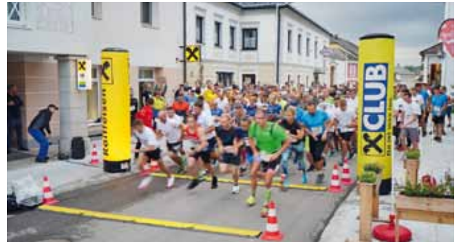
Foto: Fast 300 Starterinnen und Starter stellten sich den 5 km beim Mostviertler Businessrun.