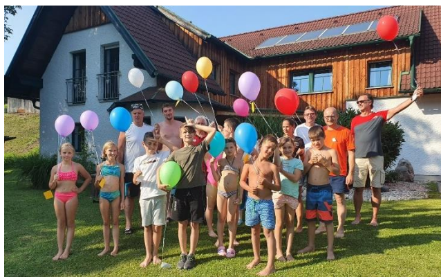
Naturspektakel (SPÖ Behamberg)