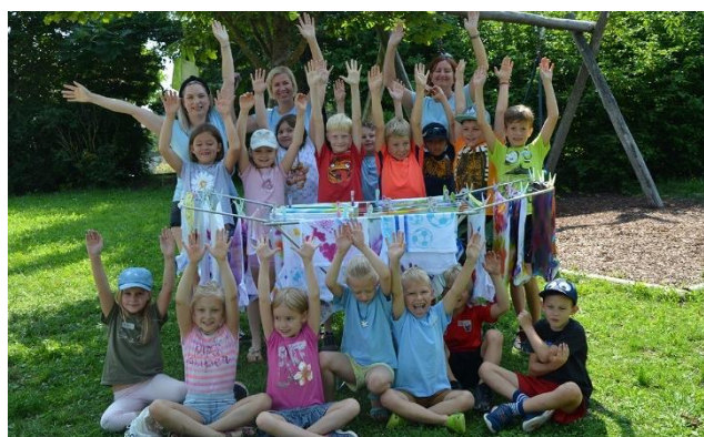
T-Shirt besprühen (EKIZ Behamberg)