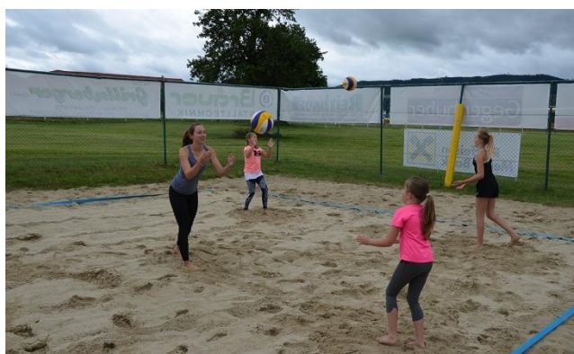
Beachvolleyball (Behamberger Beach Club)