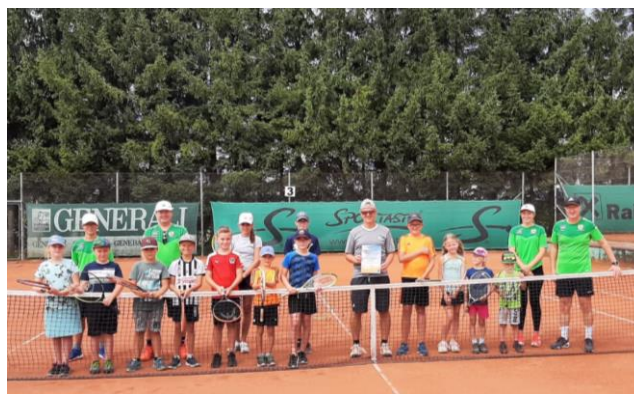
Fun & Action am Tennisplatz (UTC Haidershofen)