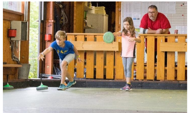
Stocksport (Stocksport Karrer)