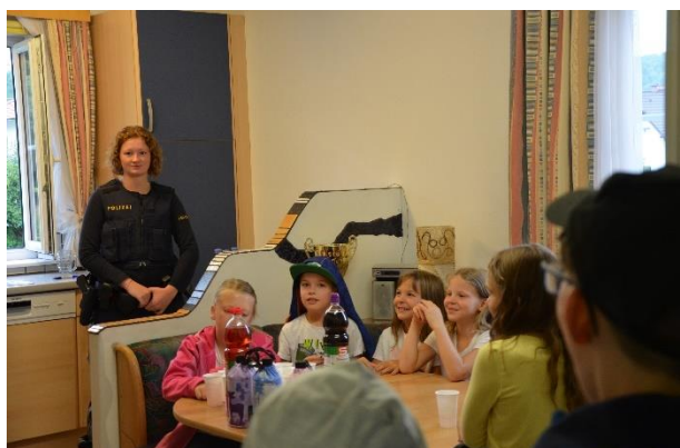
Polizei hautnah (Polizei Haidershofen)