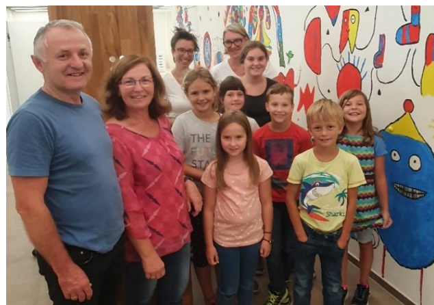
Wandgemälde mit dem Bürgermeister

Gemeindeamt Parteienverkehr: Mo. u. Do. 7.00 – 12.00 Uhr, Di. 7.00 – 12.00 und 13.00 – 18.00 Uhr, Mi. 7.00 – 13.00 Uhr, Fr. 7.00 – 14.00 Uhr