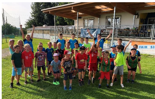
Fußball (ASV Behamberg-Haidershofen)