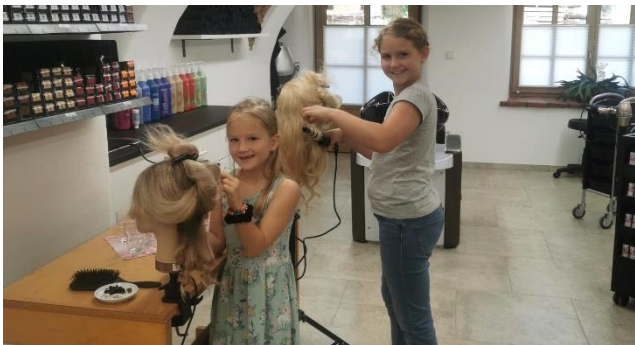
Frisörbesuch (Salon Haarfee)