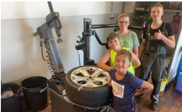
Autoschrauber (KFZ Steindl)