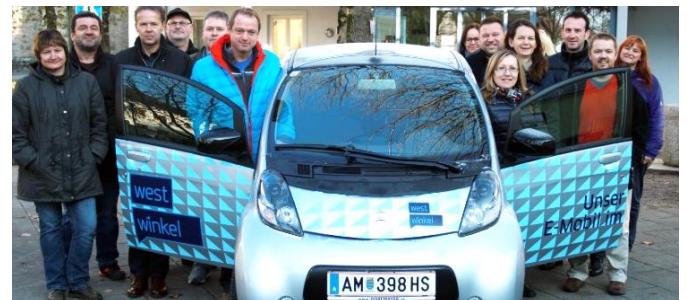
Das kostenlos auszuleihende E-Auto mit Westwinkelvertretern.

Ab 1. Mai 2021 steht der Marktgemeinde Strengberg - wie bereits im Oktober 2017 - einen Monat lang ein über die Westwinkel-Gemeinschaft angeschafftes Elektrofahrzeug der Marke CITROËN zur Verfügung. Zur Förderung der E-Mobilität in Strengberg können interessierte Gemeindegänger dieses Fahrzeug kostenlos probefahren. Zum Tanken steht die E-Tankstelle in der Buchstraße zur Verfügung.