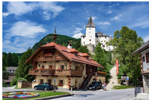
Mauterndorf im Lungau

Nähere Information: Flyer liegt auf der Raiba auf!