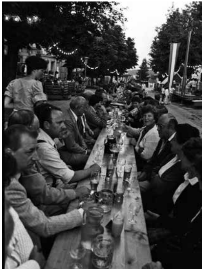
Ende der 1980er-Jahre nahmen viele Kirtagsbesucher am größten Stammtisch der Welt Platz. Daraus entstand das St. Peterer Marktfest.