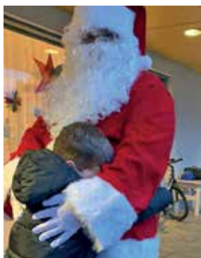
Die Freude bei den Kindern der Einrichtung „Rettet das Kind“ über die Weihnachtsüberraschung war groß!

Für gewöhnlich bekommt jeder der 50 VIP Gäste der High Five Bar monatlich einen 10€ Gutschein gesendet. Betreiber Manuel Sperl hatte die Idee, die Dezember-Gutscheine einem wohlthätigen Zweck zuzuführen. 40 der 50 VIP Card Besitzer willigten ein ihren Gutschein zu spenden und somit konnte ein Betrag von 400€ gesammelt werden. Zusätzlich wurde dieser Betrag von der High Five Bar durch eine Spendenbox bei der Speisenabholung auf circa 500€ aufgestockt.