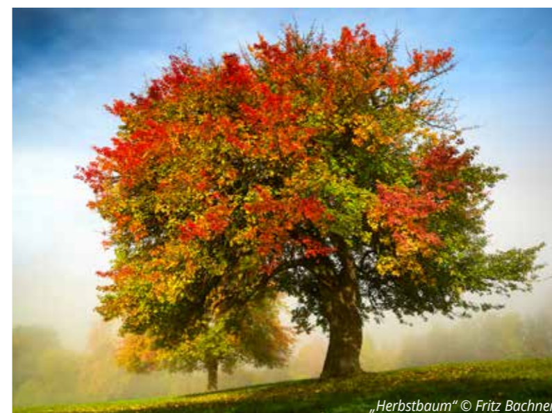
„Herbstbaum“ © Fritz Bachner