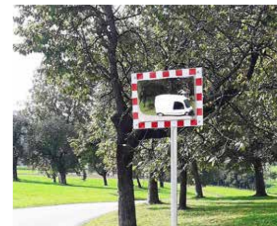
Neuer Verkehrsspiegel in Baichberg