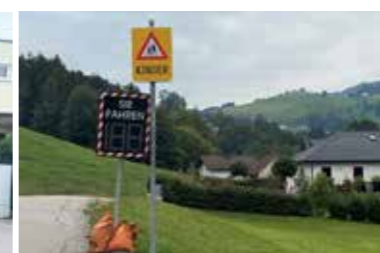
Einsatz des mobilen Geschwindigkeitsmessgerätes im gesamten Gemeindegebiet