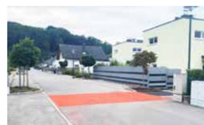
Bodenmarkierung Sonnensiedlung in Rosenau

In den letzten Wochen wurden diesbezüglich einige Initiativen durchgeführt.