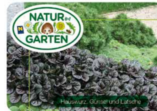
Hauswurz, Günsel und Latsche