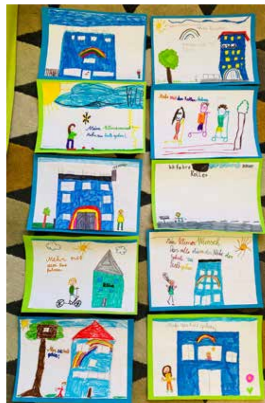
Zeichnungen der Kinder der 3. Klasse der VS Böhlerwerk

Die Kinder der Volksschulen Rosenau und Böhlerwerk namen an der Malaktion „Mein Klima-Wunsch“ teil, die in der