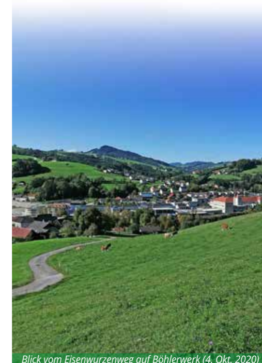
Blick vom Eisenwurzenweg auf Böhlerwerk (4. Okt. 2020)

Ein im Besitz der Marktgemeinde befindliches Gartengrundstück in Böhlerwerk (Bereich Hochbehälter/Nellingstraße) im Ausmaß von 737 m 2 kann zu bestimmten Bedingungen verpachtet werden. Interessenten bitten wir, sich bis spätestens 30. November 2020 am Gemeindeamt zu melden.