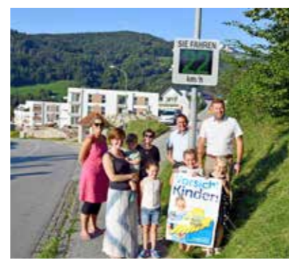
Neues Tempomeßgerät in Böhlerwerk/Nelling

Laufende Projekte (z.B. Geh- und Radwege, Querungshilfen, zeitgemäße Verkehrsspiegel etc.) sollen die Verkehrssicherheit auf den Straßen unserer Gemeinde erhöhen.