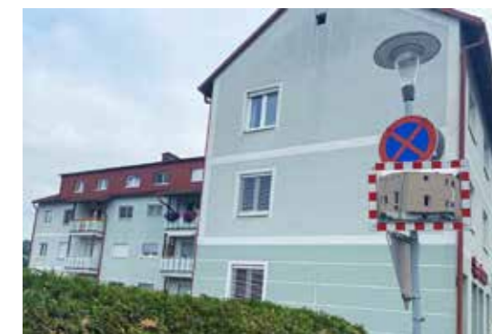
Neuer Verkehrsspiegel in Rosenau