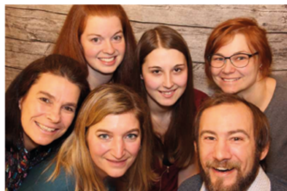
Das JUSY Team in Waidhofen/Ybbs:

Sollte es nicht möglich sein, persönlich vorbeizukommen, können die Beratungen und Infogespräche auch telefonisch, per Mail oder per Videotelefonie über Zoom stattfinden.