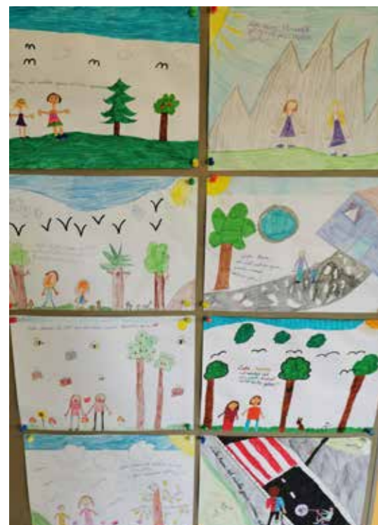
Zeichnungen der Kinder der 4. Klasse der VS Rosenau

Europäischen Mobilitätswoche von 16. bis 22. September 2020 durchgeführt wurde. Ziel ist, die Motivation zum Gehen, Rad- und Rollerfahren zu heben, sich mit dem Thema Klima zu beschäftigen und möglichst viele Wege zu Fuß oder mit dem Rad zurückzulegen. Nur so ist es möglich, den Autoverkehr vor der Schule ein wenig zu reduzieren.