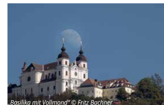
„Basilika mit Vollmond“