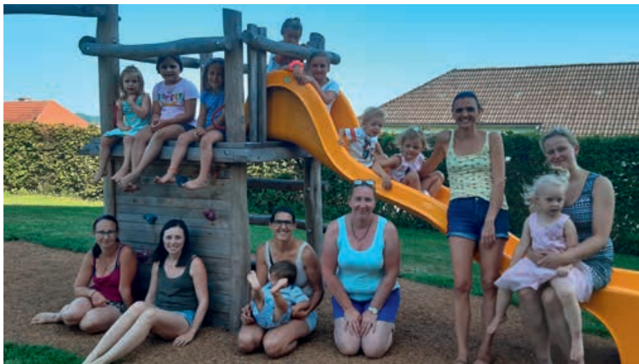
Beim Abschlussfest verbrachten die Kinder noch einmal einen schönen gemeinsamen Nachmittag am Spielplatz bei der Volksschule.

Wenn du auch zum „St. Georgner Flohhaufen“ gehören möchtest, melde dich in der Zeit von 7. bis 18. September 2020 bei Silvia Riedler an. Die Anmeldung ist für Kinder ab