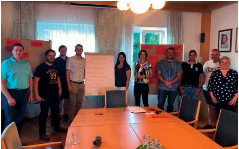
Der Arbeitskreis „Mobilität“ beschäftigt sich mit vielen Angelegenheiten rund um die Themen Öffentlicher Verkehr, Wegenetz, Internet, Verkehrsbelastung, uvm.