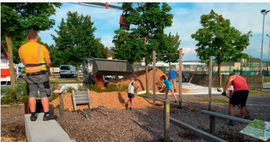
Die Hackschnitzel, welche als Fallschutz dienen, wurden beim Freizeitplatz „Fitness im Freien“ mit der Unterstützung zahlreicher freiwilliger Helfer erneuert.

Der Fitnessplatz im Ortszentrum erfreut sich seit der Eröffnung großer Beliebtheit. Die Geräte sind öffentlich für verschiedenste Übungen zugänglich. Die aufgebrauchten Hackschnitzel dienen als Fallschutz und müssen von Zeit zu Zeit erneuert werden. Am 14. Juli dieses Jahres war es soweit, und eine Gruppe freiwilliger Helfer und die Mitarbeiter des Bauhofes brachten neue Hackschnitzel auf.