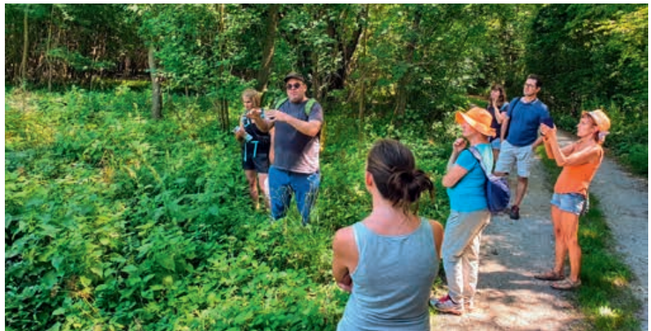
Bei strahlendem Sommerwetter zeigten gut 30 TeilnehmerInnen Interesse an den naturschutzfachlichen Schätzen in der Doislau.

Auch die Wildbiene des Jahres, die Auen-Schenkelbiene, wurde beob-