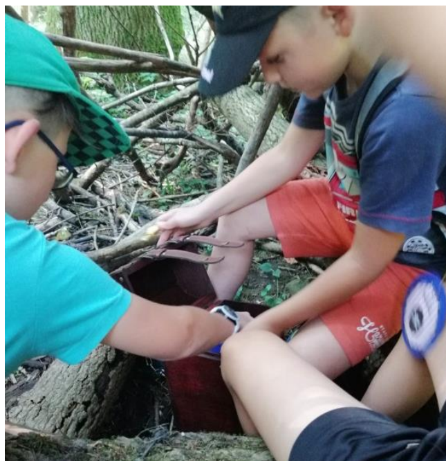
Der versteckte Behambischatz (Elternverein VS)