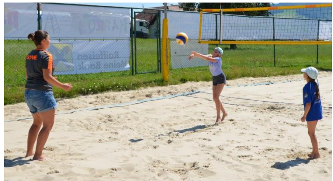
Erste Versuche beim Beachvolleyball