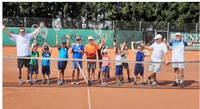
Fun und Action am Tennisplatz (UTC Haiderhofen)