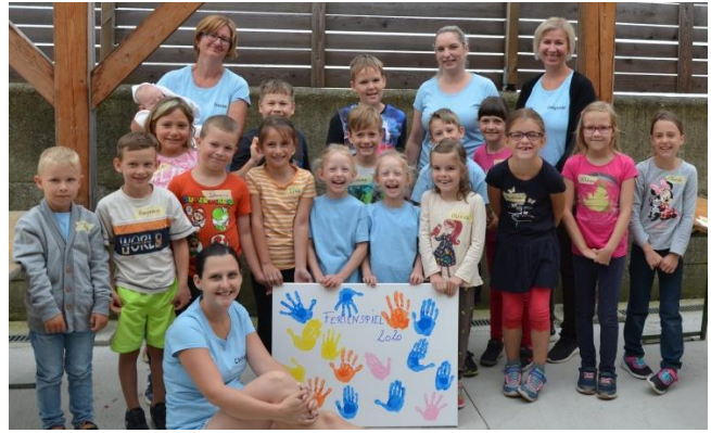
Vogelhäuschen gestalten (EKIZ Bergzwergerl)