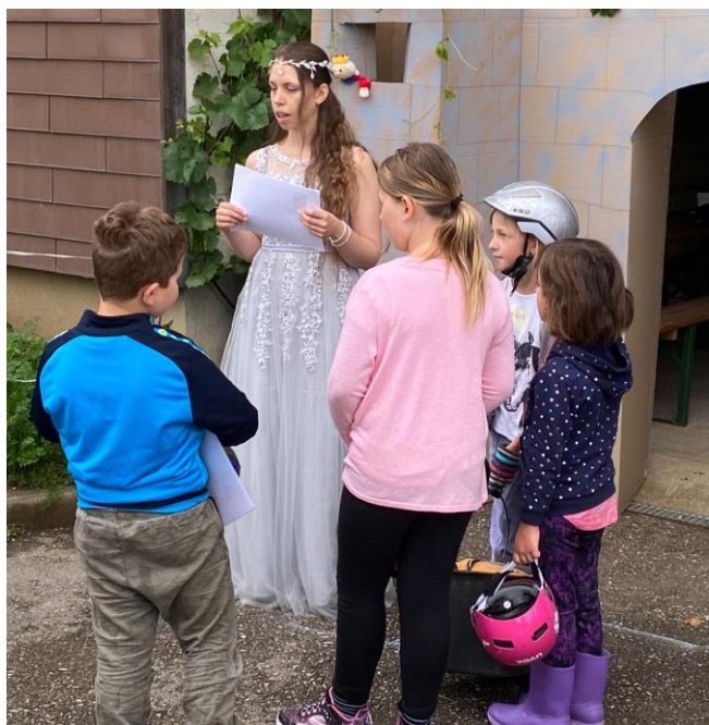
Ritterspiele & das kleine Schlossgespenst (N. Oberradter)