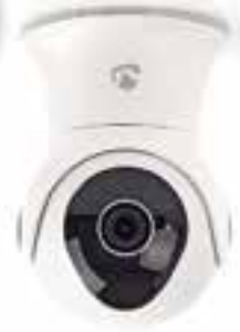
ÜBERWACHUNGS-/ NETZWERKKAMERA WIFICO20CWT Full HD

Die Full HD-Kamera mit einem 1/3-Zoll-CMOS-Sensor, für eine kristallklare Auflösung, wird ausgelöst, wenn Geräusche oder Bewegungen erkannt werden.