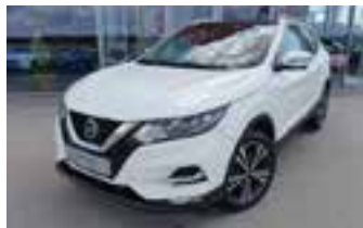
statt 30.924,- nur 24.450,-