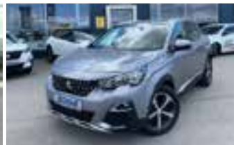
statt 38.328,- nur 29.990,-