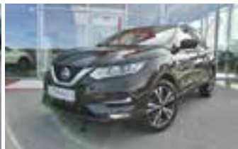
statt 30.924,- nur 24.450,-