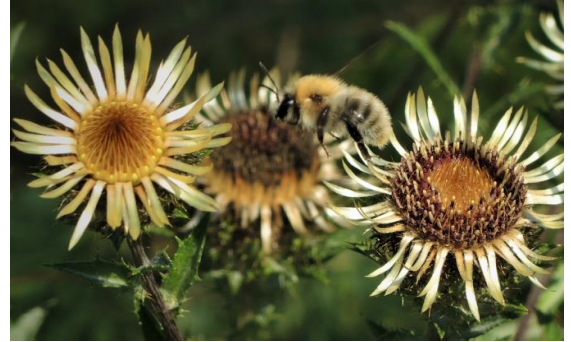
Ackerhummel

Infos und Anmeldung: Die Energie- & Umweltagentur des Landes NÖ, amstetten@enu.at, www.enu.at/veranstaltung