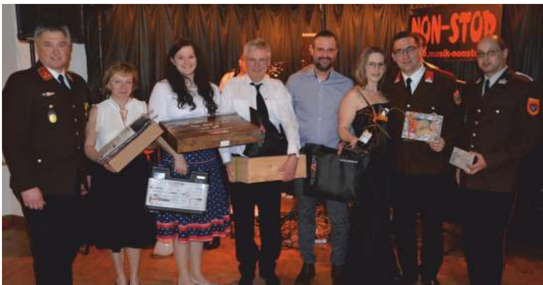
Die Gewinner des Schätzspieles.

Mehr Fotos dazu finden Sie auf der Homepage unter www.ff-allhartsberg.at