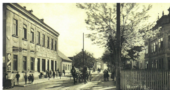
Foto: Das Gebäude im Wandel der Zeit