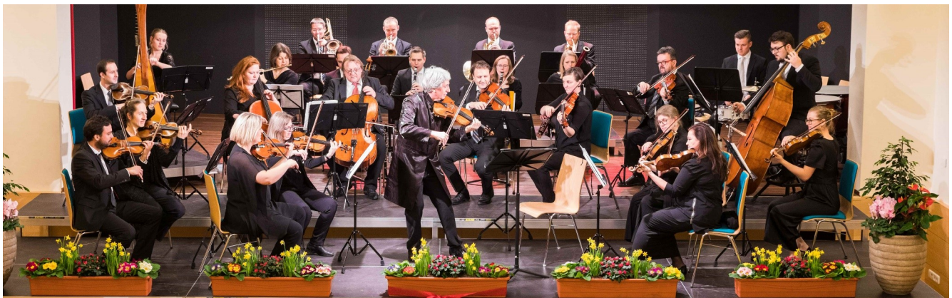
Foto: Das Strauß-Orchester Ybbstal spielte im Veranstaltungszentrum kem.A[r]T ein großartiges Neujahrskonzert

Hörgenuss auf höchstem Niveau bot auch dieses Jahr wieder das Kematner Neujahrskonzert im ausverkauften Veranstaltungszentrum kem.A[r]T. Bei der vom Kulturreferat bestens organisierten Veranstaltung spielte das Strauß Ensemble Ybbstal des Musikschulverbandes Region Sonntagberg musikalische Ohrwürmer wie die Strauß Klassiker „Tritsch-Tratsch Polka“ oder „Kaiser-Walzer“ und sorgte für Begeisterung. Ein musikalischer Abend mit bester Unterhaltung für alle Liebhaber klassischer Musik. war garantiert.