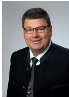
Erwin Pittersberger Bürgermeister