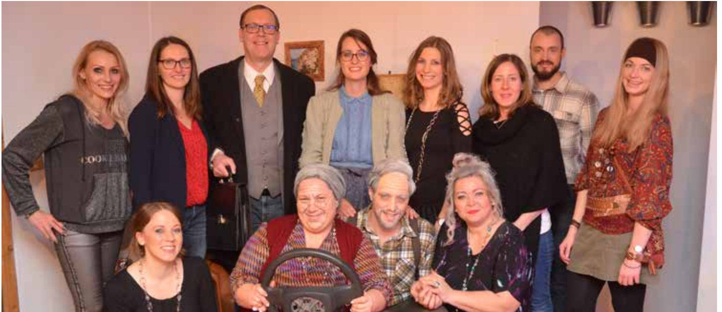
Erfolgreiche Theaterpremiere „Alles Paletti“