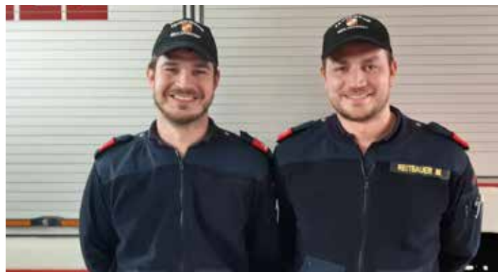
Bericht: Matthias Witzlinger

Wir sind sehr stolz auf diese tolle Leistung und gratulieren recht herzlich.