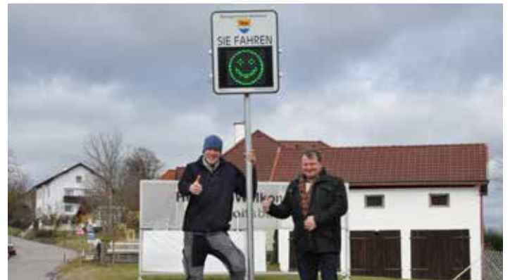
Für mehr „Verkehrssicherheit“ im Ort