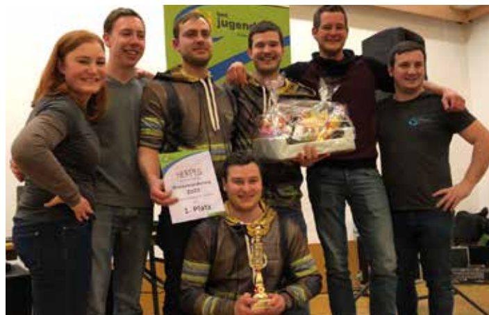
Bericht: Nadine Fellner

Wir erreichten alle 3 Stockerlplätze, sowie den 8. Platz in der Wertung. Ebenso konnten wir den 1. Platz in der Gesamtwertung für unseren Bezirk St. Peter/Au holen.