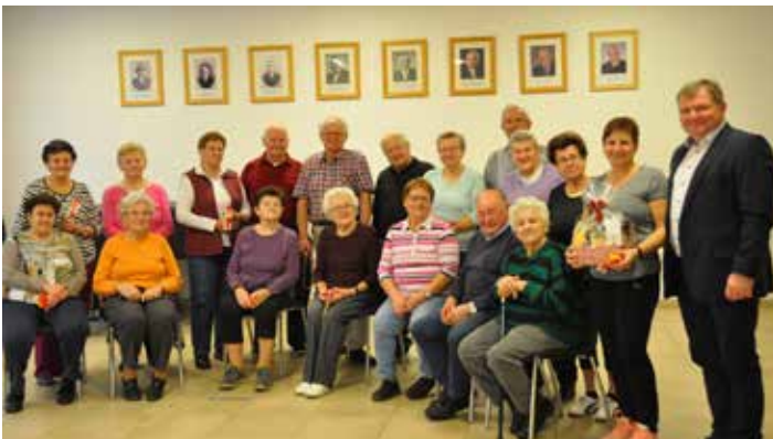
Unsere aktiven „Sesseltuner“