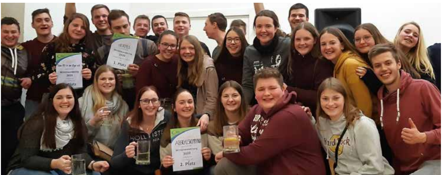
Bezirks-Winterwanderung 2020 in St. Valentin: Den 1. 2. 3. und 8. Platz belegte unsere Landjugend Wolfsbach