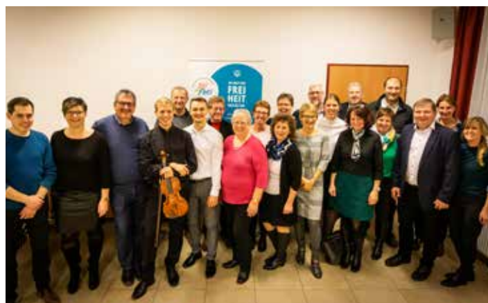
Bericht: Josef Penzendorfer

Mit dem Reinerlös des Abends unterstützt Aichberger die entwicklungspolitische Organisation Sei So Frei der katholischen Männerbewegung, die Projekte in sechs Ländern Lateinamerikas und Afrikas durchführt. Projektleiterin Elisabeth Tanzer, selbst Wolfsbacherin, führte durch den Violinabend und gab einen kurzen Einblick in ihre Projekte mit den Schwerpunkten Wasserversorgung, Landwirtschaft und Bildung. Nähere Informationen zu den Projekten von Sei So Frei unter ooe.seisofrei.at .