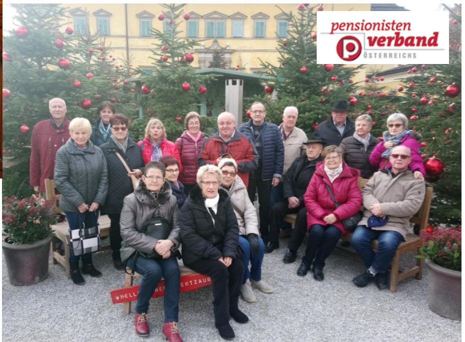
Bild rechts: Bei einer vorweihnachtlichen Fahrt nach Salzburg stattete man unter anderem dem Hellbrunner Advent einen Besuch ab.

Terminvorschau: Im März 2020 findet ein Bunter Nachmittag im GH Pitzl statt, zu dem wir schon jetzt herzlich einladen!