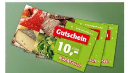
Auch Gutscheine von Nah&Frisch können bei uns erworben und eingelöst werden!