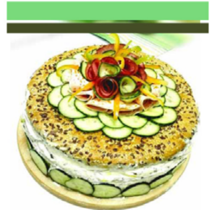
Pikante Sandwichtorte, gefüllt mit Aufstrich, Wurst, Käse, ganz nach ihren Wünschen