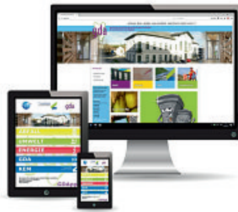
Die GDA-App der Klima- und Energiemodellregion steht für IOS und Android-Geräte kostenlos zum Download bereit

Diese erinnert Sie zeitgerecht an die nächsten Abholtermine und erleichtert eine zuverlässige Abholung von Ihrer Liegenschaft. Durch das neue „Trenn ABC“ wissen sie ganz genau welche Altstoffe wie und wo entsorgt werden müssen und leisten dabei einen wichtigen Beitrag zu einer nachhaltigen und effizienten Abfallwirtschaft. Zusätzlich zu den genannten Funktionen bietet die neue „GDA APP“ die Möglichkeit das nächste und geöffnete Altstoffsammelzentrum schnell zu finden und gibt weitere wichtige Tipps und Informationen für eine saubere Umwelt.