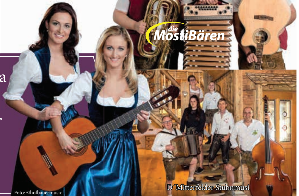
D' Mitterfelder Stubnmusi