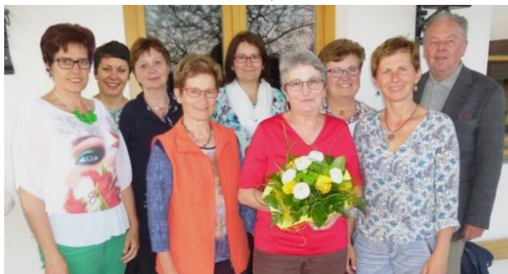
Das Team der Pfarrbücherei Strengberg freut sich auf Ihren Besuch (Archivbild).

Am 09. und 10. November 2019 findet in den Pfarrräumen im Amtsgebäude (Markt 10) eine Buchausstellung statt, die von der Pfarrbücherei Strengberg veranstaltet wird. Am 09. November (SA) in der Zeit von 9-12 Uhr sowie 16-19 Uhr und am 10. November 2019 (SO) von 9-16 Uhr. Nutzen Sie die Möglichkeit, sich ein Buch zu kaufen.