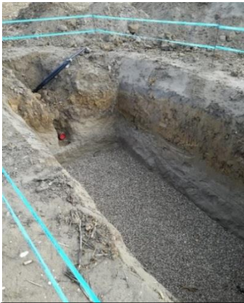
Ausgehobene Grube in der Au zur Querung der Landesstraße.

Die Bauarbeiten für die Errichtung einer Brunnenanlage in der Au schreiten zügig voran und liegen im Soll (eine Fertigstellung ist bis Ende 2019 vorgesehen). Die Wasserleitungen zum Brunnen selber wurden bereits verlegt (auch Strom). Noch durchzuführen sind der Anschluss der Ortschaft Gerstberg, die Anpassung des Wasserhauses (Einbau Steuerungsanlagen usw.) in der Limbachstraße, die Erneuerung der Wasserleitungen in der Limbachstraße sowie die „Errichtung bzw. Verkleidung“ des Brunnens selber. Auch sind die Anschaffung von zwei Notstromaggregaten sowie die Aufschüttung der Brunnenanlage (als Hochwasserschutz vor einem 100-jährigen Hochwasser) noch durchzuführen. Im Zuge der Arbeiten kann es vereinzelt zu kurzfristigen Wasserabschaltungen kommen. Da dies der Gemeinde durch die Baufirma immer sehr kurzfristig mitgeteilt wird, ist eine Vorankündigung der entsprechenden Siedlungen bzw. der davon betroffenen Bevölkerung nur schwer