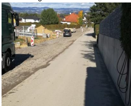
Nun zweispurig - aber noch nicht freigegeben.

schließungsstraße Richtung Fußballplatz bzw. Wohnblöcke Heimat Österreich auf zwei Fahrstreifen verbreitert und eine Regenwasserentwässerung in den angrenzenden Achleitnerbach errichtet. Von den 14 Parzellen wurden bereits 9 Parzellen verkauft (4 sind derzeit reserviert, eine ist noch frei). Bei 3 Parzellen wurde bereits mit dem Bau eines Wohngebäudes begonnen.