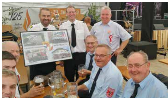
Geschenkübergabe an die FF Wolfsbach