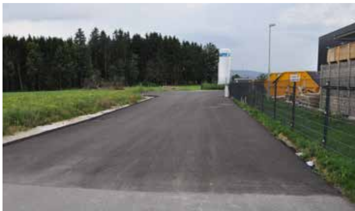
Fertigstellung der Zufahrtstraße bei der Fa. Systron