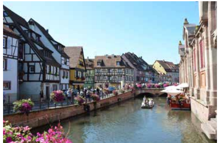
Eindrücke aus Colmar