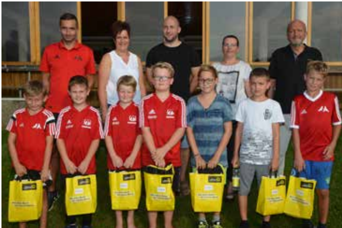
Die Gewinner des Ferienprogramms

FF Wolfsbach Union Wolfsbach Sektion Beachvolleyball FF Meilersdorf Goldhaubengruppe Wolfsbach Jagdgesellschaft Wolfsbach, Bubendorf, Meilersdorf Union Wolfsbach Sektion Fußball