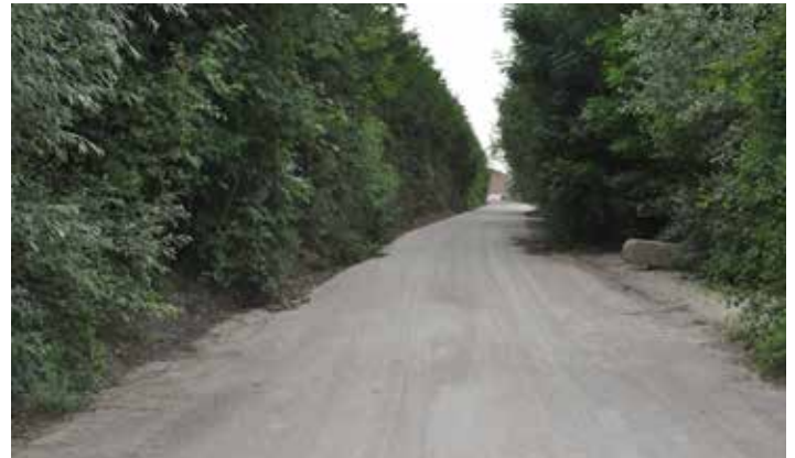
Straßensanierung beim Gemeindeweg Wallner - Hinkermühle