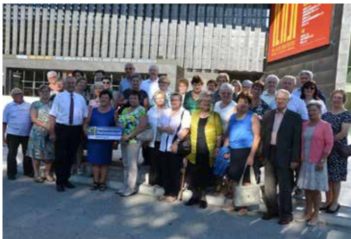
Gruppenfoto vor dem Musiktheater