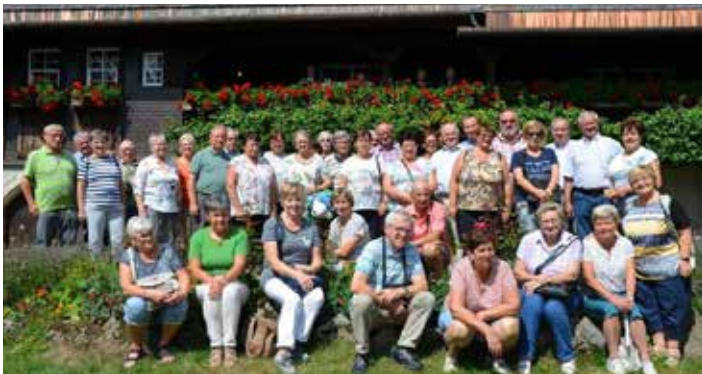
Gruppenfoto beim Hüsli Museum