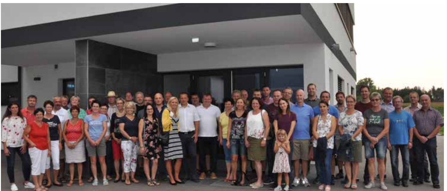
Exkursion des Ortsbauernrats, den Ortsbäuerinnen und Kirtagshelferinnen mit Partnern bei der Fa. Systron.