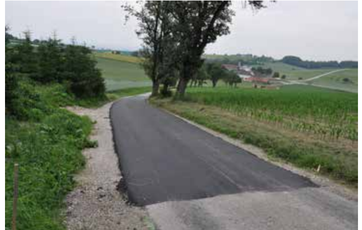
Straßensanierung beim Güterweg Bruderberg