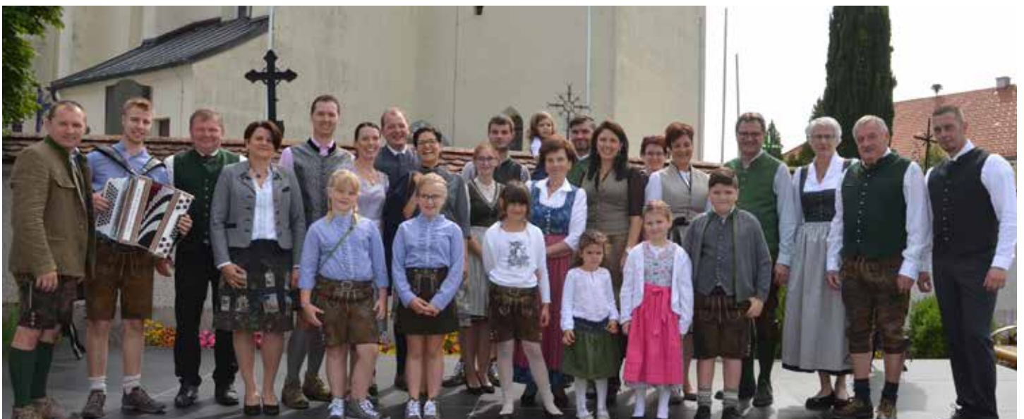
Erfolgreiche Trachtenmodenschau beim Dirndlgwandsonntag am Marktplatz