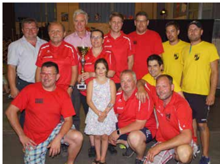
Sieger der Herrenwertung: „Stockschützen“

Auch heuer stand wieder der Bewerb um den „Strongmen“ am Programm. Viele top motivierte Gruppen kämpften um jeden Punkt. Am Ende standen die Sieger der Herren- und Damengruppen fest.