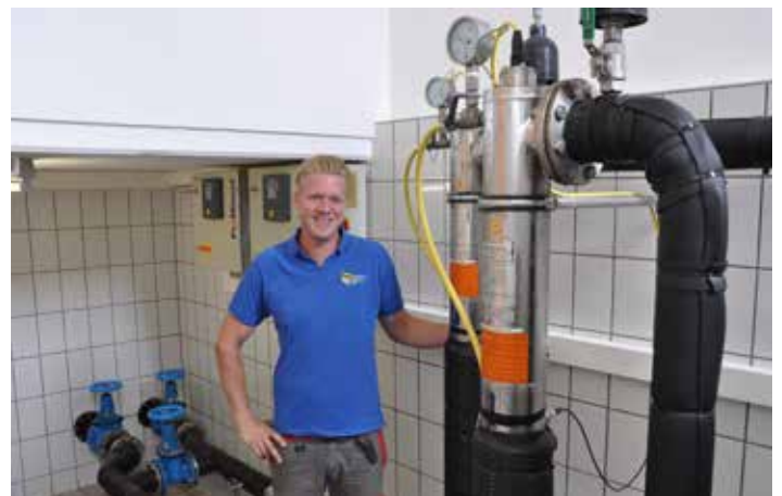
Die UV-Entkeimungsanlage, im Brunnenhaus in Hinterberg, wird umgebaut

Weiters kam es voriges Jahr in Höfart und in Loosdorf zu akuten Wasserproblemen.