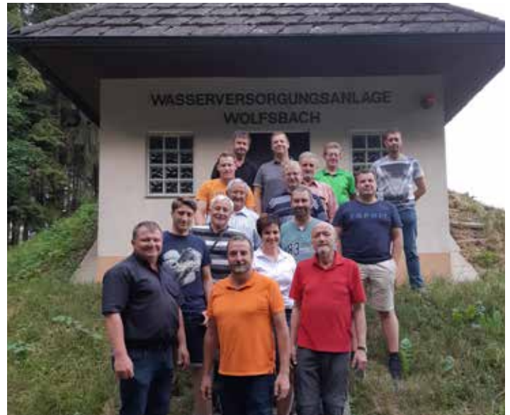
Besichtigung des Gemeinderates in der Wasserversorgungsanlage Wolfsbach in Grillenberg