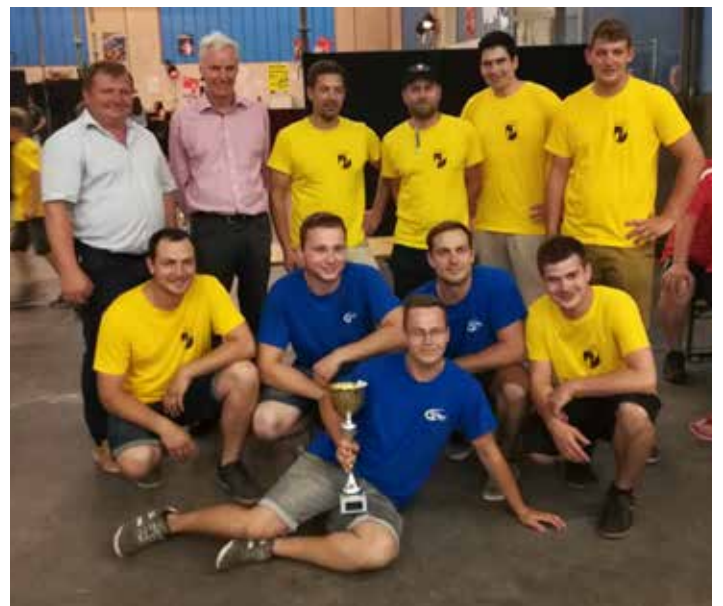
Bericht: Anna Fuchsberger

Auch beim Sommerfest der FF - Meilersdorf waren wir schon am Nachmittag stark vertreten und unsere Burschen erreichten beim Strong Men den hervorragenden 2. Platz und die Mädels den tollen 3. Platz.