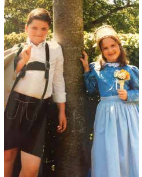
Bericht: Anna Dirnberger

Helene + Lukas präsentieren das 1. Lebensjahrzent